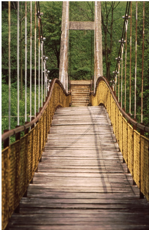
Inženirski objekt: Brv nad Savo (Renke)