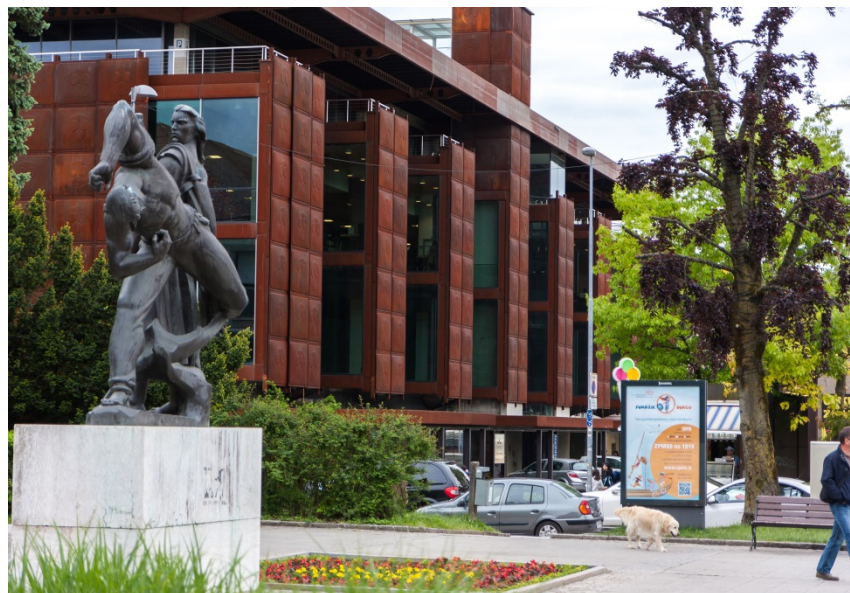
Inženirski objekt: Mestna mesnica, Kranj