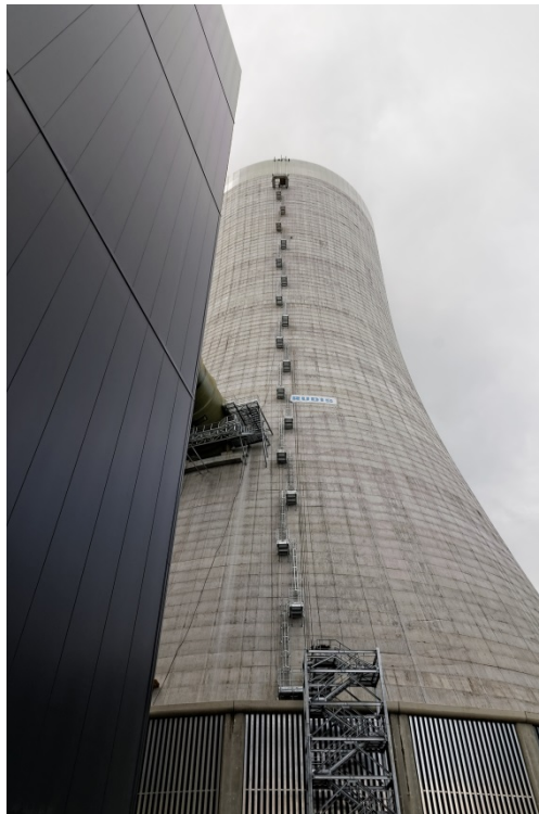
Inženirski objekt: TEŠ 6