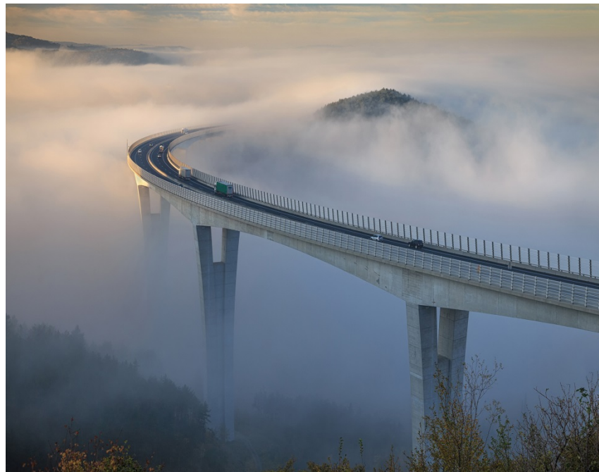
Inženirski objekt: Viadukt Črni kal