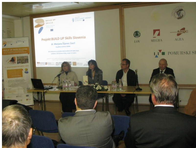
Predstavitve predloga načrta na sejmju MEGRA, Gornja Radgona, dne 5.4.2013.