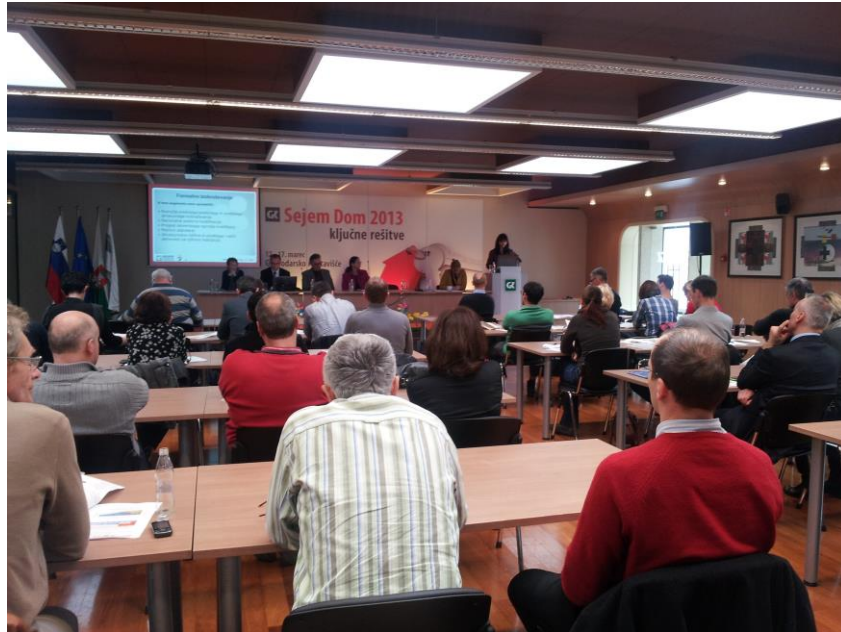
Predstavitve predloga načrta na sejmju DOM, Ljubljana, dne 13.3.2013.