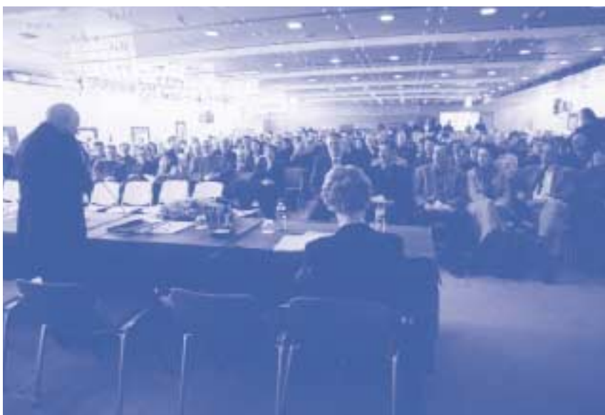
Udeleženci ustanovnega zbora ZAPS

Zbora se je udeležilo 273 članov sekcije in številni gostje (predstavniki ministrstev, IZS, fakultete in strokovnih društev), skupaj približno 300 udeležencev.