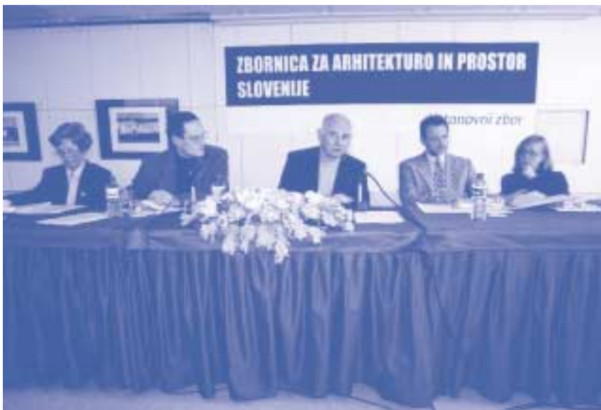
Delovno predsedstvo ustanovnega zbora ZAPS

Po tem zboru je ZAPS formalno ustanovljena, uradno pa bo začela delovati, ko bo sprejela Statut in zadostila še nekaterim tehničnim pogojem, ki so predpisani - predvidoma v jeseni.