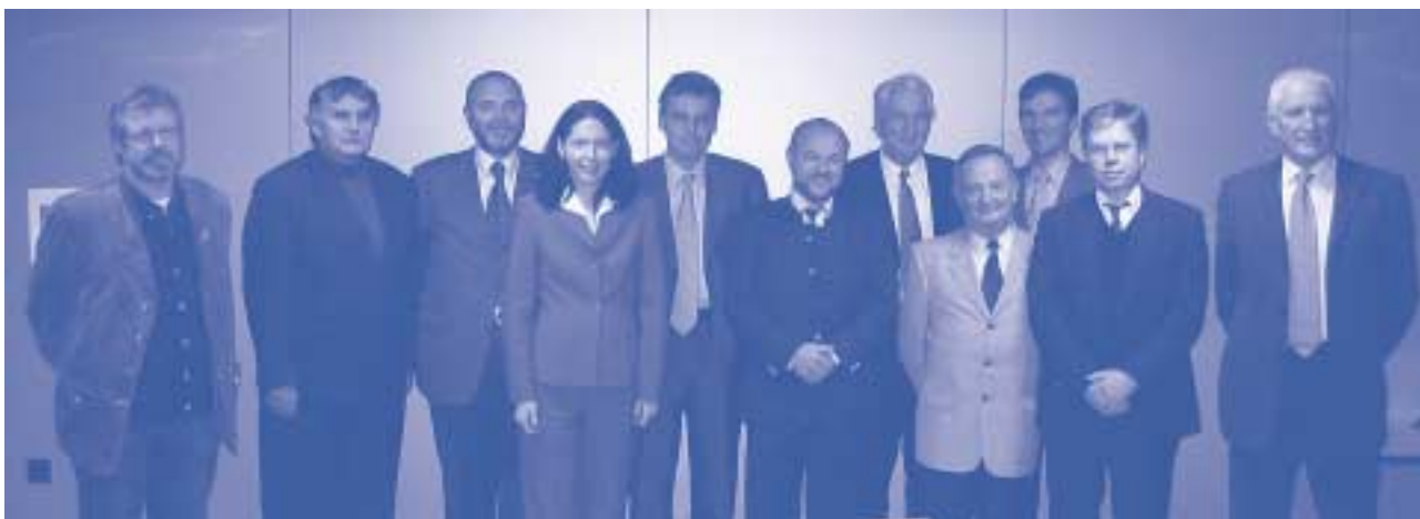
Udeleženci 1. sestanka delovne skupine za ustanovitev Evropskega sveta inženirskih zbornic

V nadaljevanju so bile ustanovljene 3 delovne skupine, in sicer za pripravo statuta (pod vodstvom Nemčije), za finančne zadeve (pod vodstvom Slovenije) in za mednarodne povezave (pod vodstvom Avstrije), ki so takoj začele z delom.