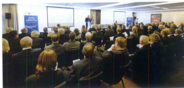
Udeleženci 2. Evropskega inženirskega dne.

• Inženirske rešitve so vedno zasnovane ob upoštevanju gospodarskih, varnostnih in funkcionalnih vidikov. Veliko današnjih družbenih izzivov, kot so okoljska trajnost, staranje infrastrukture, uvajanje inovativnih obnovljivih virov energije in gospodarska rast, ima mednarodni značaj. Zato sta internacionalizacija in čezmejno priznavanje inženirskih kvalifikacij bistvena in življenjskega pomena za ustvarjanje boljše prihodnosti družbe. Mednarodna mobilnost je danes običajen