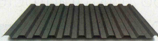
TP20 za stene in strehe