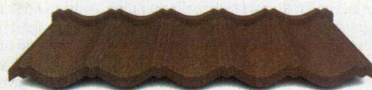
PESKANA za novogradnje