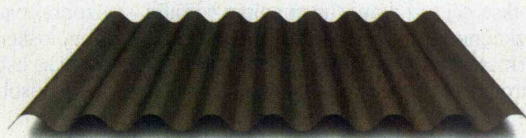
VALMETAL za naklone od 3° dalje