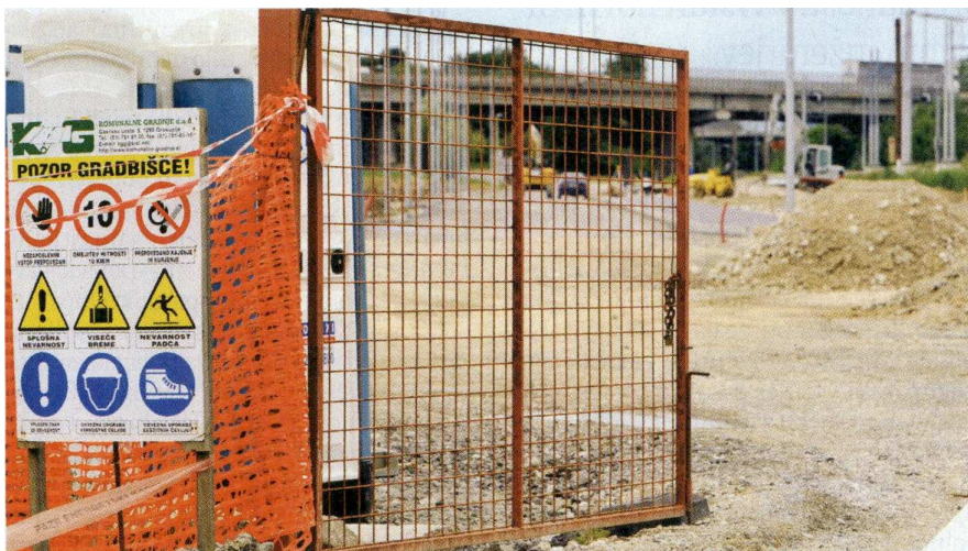
Nadzor nad označitvijo in zavarovanjem gradbišč je pokazal, da veliko gradenj ni ustrezno označenih in ograjenih.