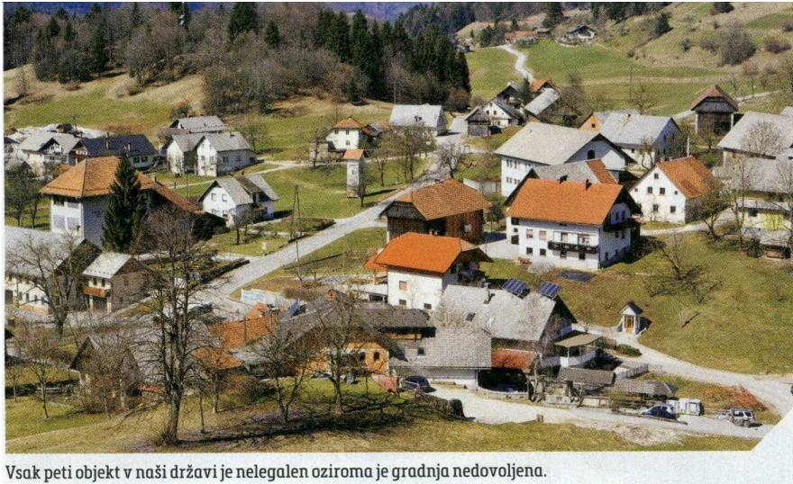
Vsak peti objekt v naši državi je nelegalen oziroma je gradnja nedovoljena.

V osemnajstih primerih je šlo na podlagi ZGO-1 tudi za nevarne gradnje, zato so inšpektorji odredili takojšnjo prepoved uporabe objektov in določili rok za njihovo odstranitev oziroma zavarovanje. »Na podlagi GZ je bil ugotovljen en nevaren objekt, za katerega je bila izdana odločba skladno z GZ,« še naštejejo na inšpektoratu. Med drugim so inšpektorji izdali tudi dve odločbi zaradi spremenjene namembnosti brez gradbenega dovoljenja.