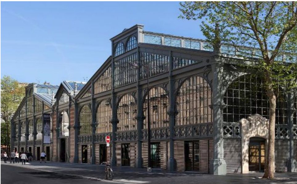
Lokacija simpozija o dnevni svetlovi in zdravih hišah.

V Sloveniji naj bi bilo potrebno v petih letih urediti še vsaj 30 tisoč objektov, saj je po raziskavah terena sodeč plesnivih več kot 50 tisoč stavb in še več jih je