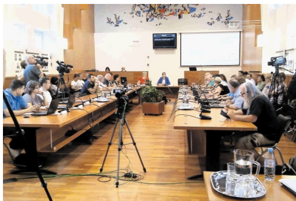
Na prvi letošnji izredni seji sveta občine Trbovlje so obravnavali le problematiko odlaganja elektrofiltrskega pepela.

Na prvi letošnji izredni seji se je sestal občinski svet občine Trbovlje, ki je imel le eno točko dnevnega reda – problematiko odlaganja odpadkov na deponijah v Trbovljah. Kot je bilo pričakovano, so bili občinski svetniki odločno proti dovažanju smeti v občino od drugod.