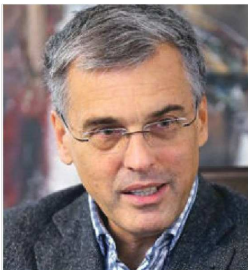
Črta Remca je KPK oprala suma, da bi bili njegovi dve funkciji – direktorja Stanovanjskega sklada RS in predsednika upravnega odbora IZS – nezdružljivi.

Samovoljne in nezakonite razlage lahko Mop drago stanejo.