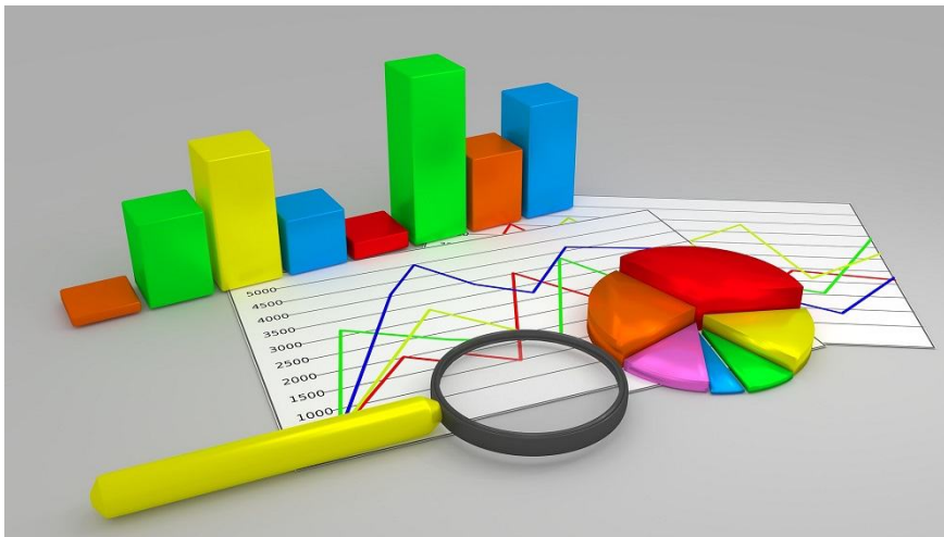
Podjetništvo v Sloveniji v letu 2018 – statistični podatki

Kako so slovenska podjetja poslovala v letu 2018 v primerjavi z letom 2017? Kolikšno dodano vrednost so ustvarila? V katerih dejavnostih so bili prihodki od prodaje najvišji?