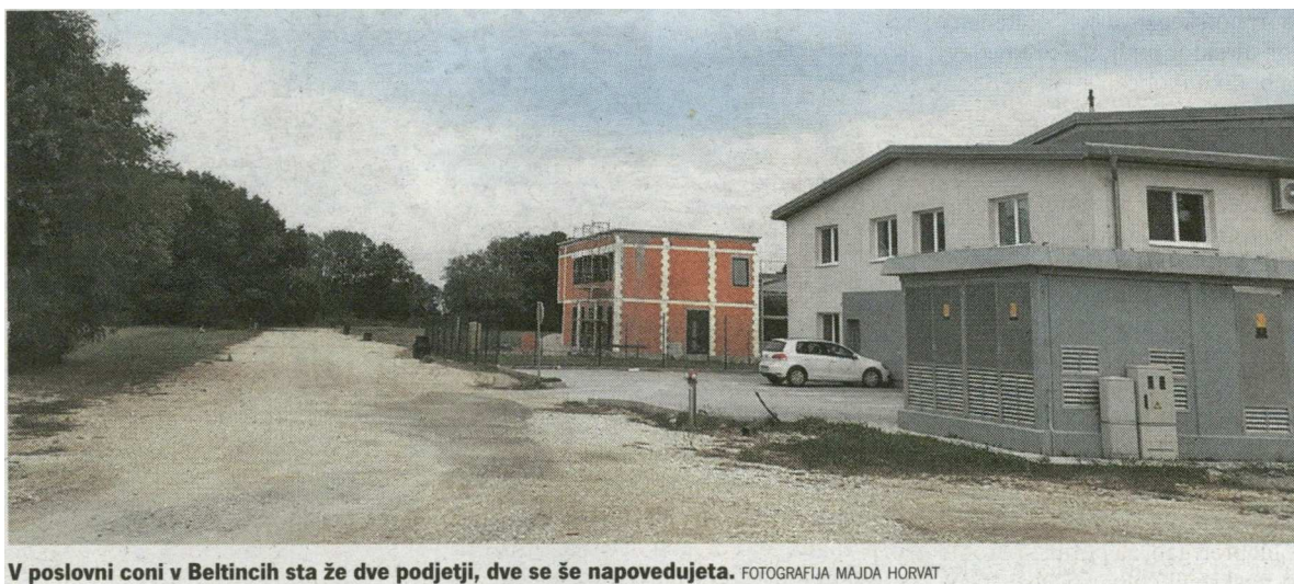
V poslovni coni v Beltincih sta že dve podjetji, dve se še napovedujeta.

Beltinski župan napoveduje, da se bodo pogovori z Luko Koper ter ministrstvom za gospodarstvo o usodi poslovne cone v Lipovcih nadaljevali