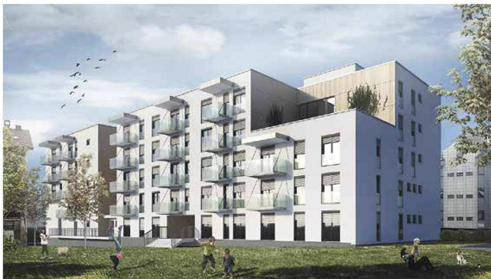
Cene nepremičnin so v regiji najvišje v Slovenj Gradcu.

V Slovenj Gradcu je sicer precejšnje zanimanje za starejše hiše ne prevelikih dimenzij, ki si jih ljudje po nakupu preuredijo po svoje. Prodajajo se za 80 do 120 tisoč evrov. Zaželeno je, da imajo novo streho in fasado. "Pri starejših hišah večjih dimenzij (nad 400 kvadratnih metrov) včasih predlagam etažiranje, saj se na tak način hitreje prodajo. Novogradnje so nekoliko manj zanimive za nakup, saj so dražje," razloži Handanovičeva. Precej zanimanja je tudi za gradbene parcele .