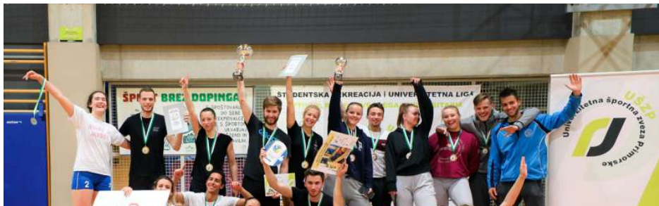
Udeleženci finalov univerzitetnih lig na primorskem