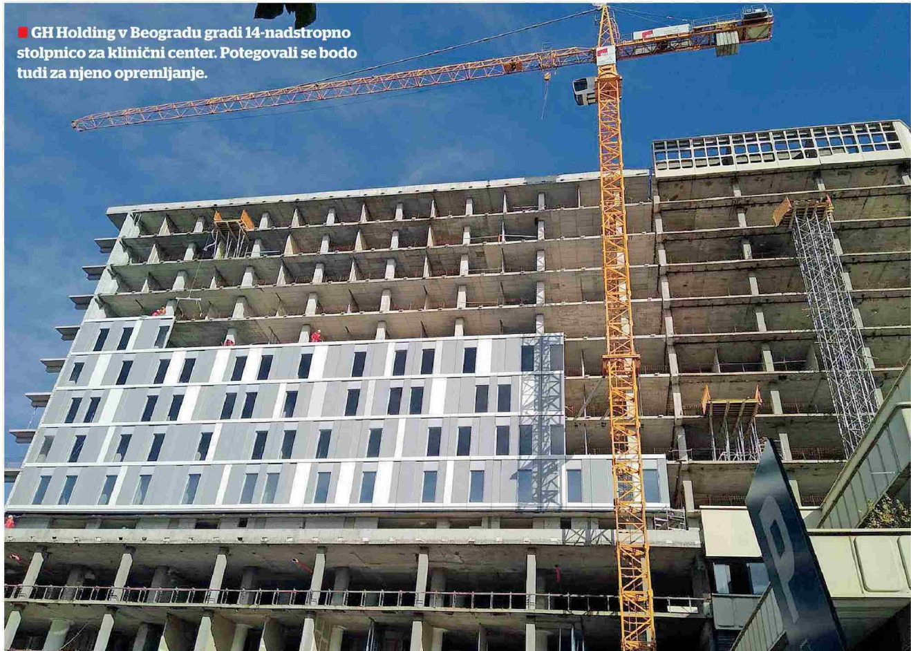
■ GH Holding v Beogradu gradi 14-nadstropno stolpnico za klinični center. Potegovali se bodo tudi za njeno opremljanje.

GH Holding bo gradil tudi v Bosni, in sicer bodo v Tomislavgradu postavili čistilno napravo. Projekt financira Evropska banka za obnovo in razvoj (EBRD).