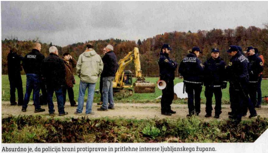
Absurdno je, da policija brani protipravne in pritlehne interese ljubljanskega župana.

čevanja vode iz reke Save. Ljubljana bi lahko izgubila ta nenadomestljivi vodni vir in ostala brez pitne vode.« Ob tem se moramo zavedati, da vodonosnik zagotavlja več kot 300.000 prebivalcem Ljubljane 90 odstotkov dnevnih potreb po pitni vodi, zato je eksistencialnega pomena za to območje.