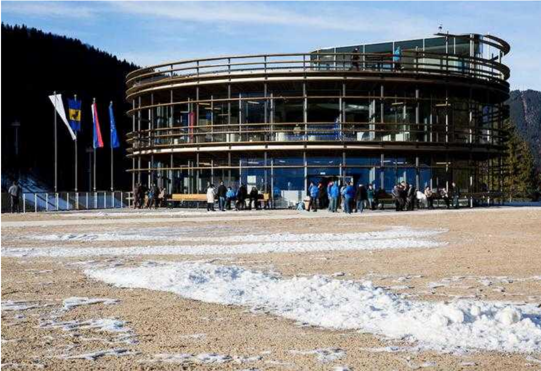
Nordijski center Planica

Podjetje Gorenjc kot podizvajalec sodelovalo pri gradnji Nordijskega centra Planica, takrat pa se je potegovalo tudi na razpisu za poljansko obvoznico. Z nakupom Gorenjca je Isajlović dobil v roke betonarno in podizvajalski posel pri gradnji Nordijskega centra Planica. Obenem je podjetje Gorenjc z družbo Elmont iz Bosne in Hercegovine ustanovilo skupno podjetje, ki se v tej državi ukvarja z izgradnjo bencinskih postaj, terminalov in rafinerij.