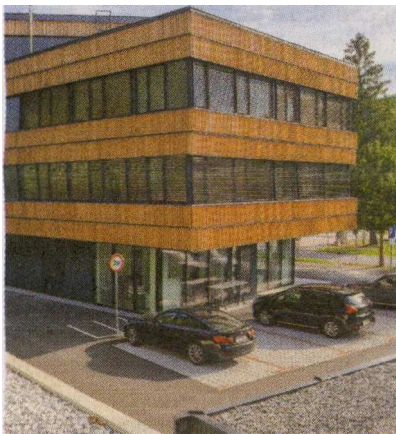
Leseni del nadstropnega volumna je postavljen nad stekleno pritličje in s tem ustvarja videz lebdenja arhitekture v prostoru.