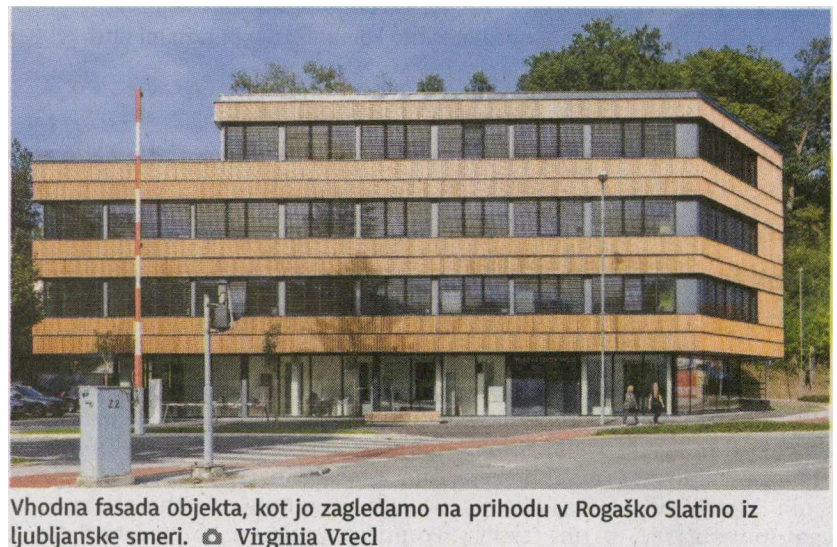
Vhodna fasada objekta, kot jo zagledamo na prihodu v Rogaško Slatino iz ljubljanske smeri.