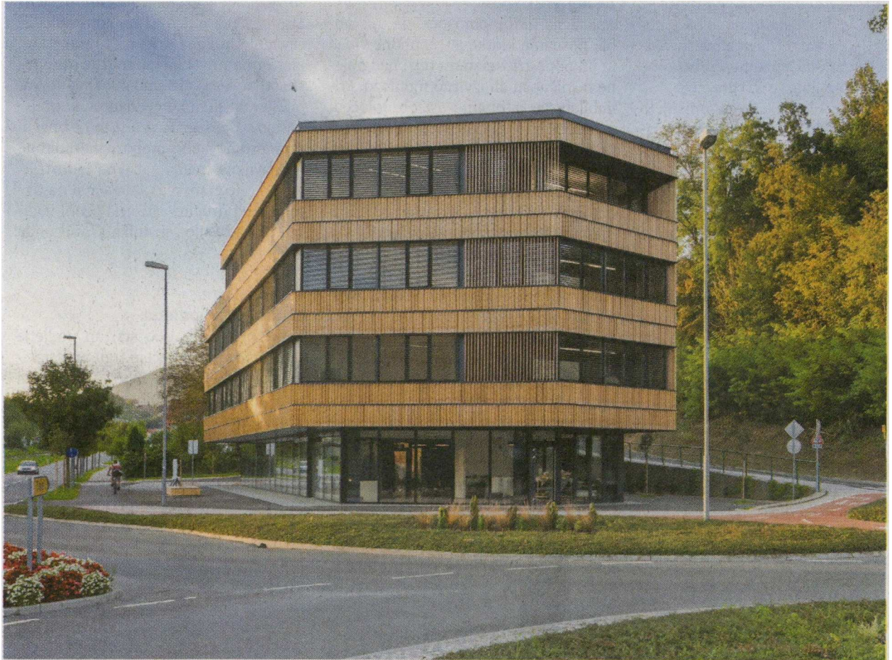
Objekt s svojo geometrijsko zasnovo sledi obstoječi infrastrukturi (železnica, cesta, krožišče ...), z balkonom v tretji etaži pa se odpira na zdraviliško promenado Rogaške Slatine.