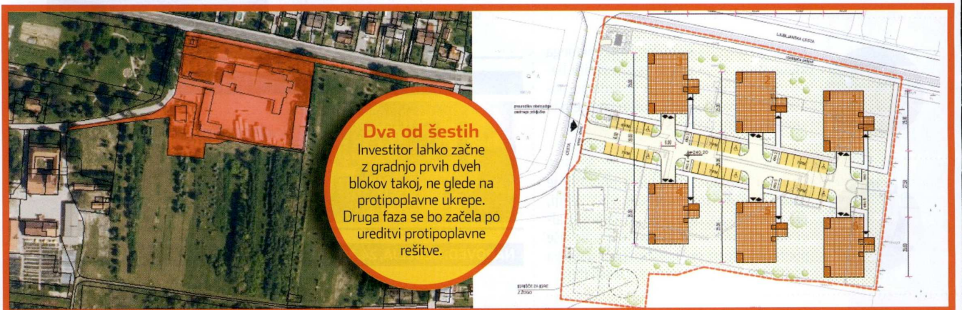
Na območju stare mlekarne bo zraslo šest blokov.