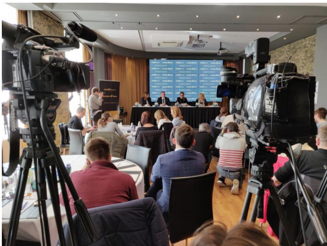
Gorenjska banka in AIK Banka

GOSPODARSTVO 20. marec 2019 -Igor Mekina / Insajder – avtorski članek