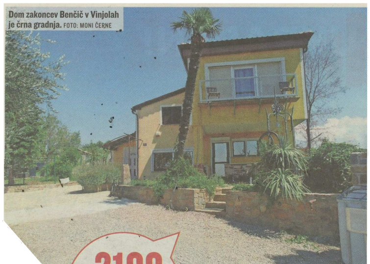
Dom zakoncev Benčič v Vinjolah je črna gradnja.