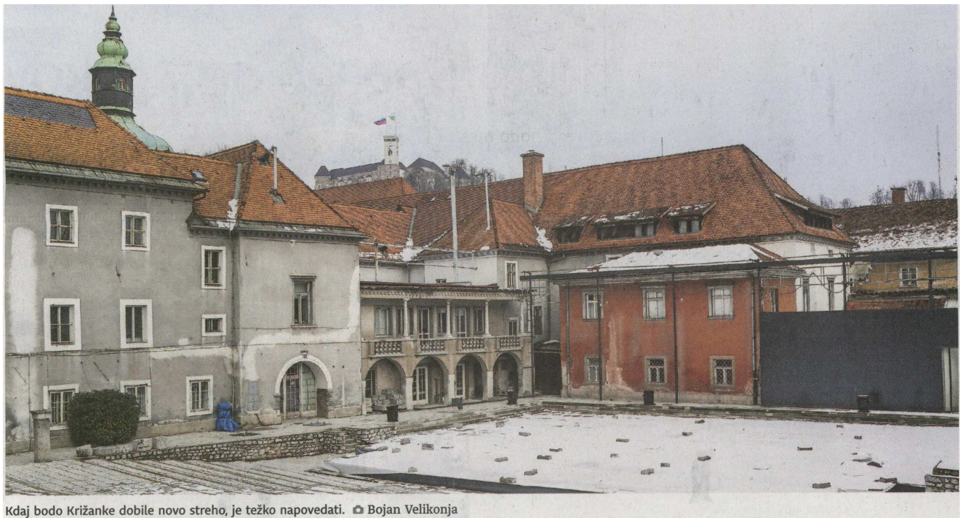
Kdaj bodo Križanke dobile novo streho, je težko napovedati. 📍 Bojan Velikonja