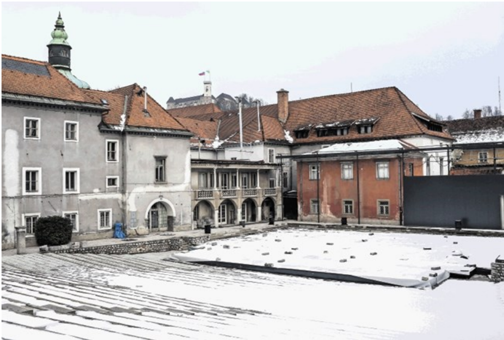
Kdaj bodo Križanke dobile novo streho, je težko napovedati.

Ker se je pri umeščanju nove strehe nad Križankami zapletlo, na občini iščejo rešitev, s katero strehe ne bi pritrdili na stavbo sosednje srednje šole, ampak bi jo sidrali v tla. Inšpekcijski postopek, ki ga je sprožil Festival Ljubljana, je medtem pokazal, da šolska stavba ni nevarna gradnja.