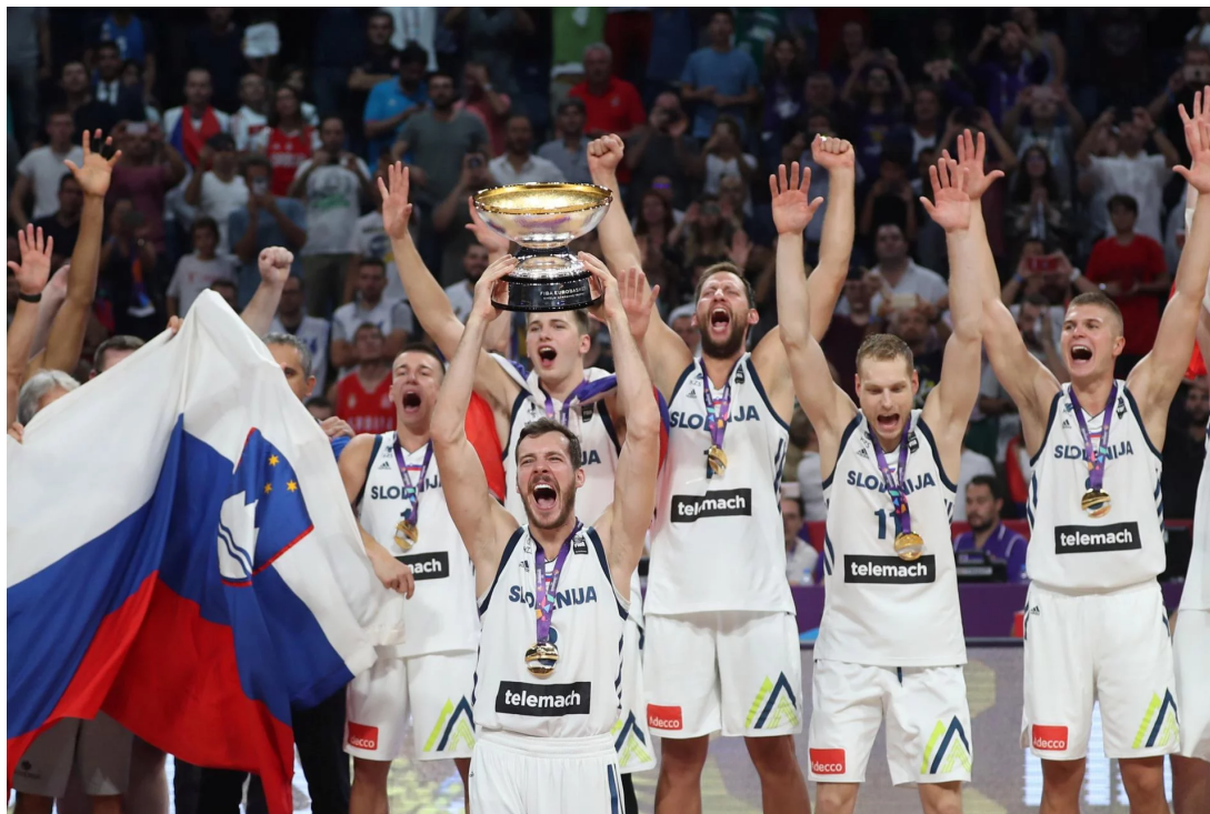
Edina fotografija, ki ne potrebuje komentarja. Turčija. Finale. Eurobasket. 2017

"Kdor ne skače, ni Sloven'c!" družno vpijemo v svetovnih arenah. Potem pride december, ko je treba za športnika leta nevhvaležno izbrati le enega najboljšega. In se radi skregamo, kaj je več, posamična ali timska trofeja, medalja v športu, ki se ga "resno gre šest držav", ali četrto mesto v športu, ki ga žgejo od Ria do Moskve. A če podvige izmerimo z najbrž najbolj merodajnim metrom, olimpijsko medaljo, je za slovenskim športom dekada, v kateri je šlo le še navzgor: 21 medalj smo pobrali na petih OI, prej v dveh desetletjih, na desetih OI, dve manj. In še politika nam je šla od rok, organizirali smo evropska prvenstva v košarki, odbojki, futsalu, imeli EP mladih nogometašev in na vrh nogometnih seniorjev, vplivnežev Uefe, postavili Aleksandra Čeferina.