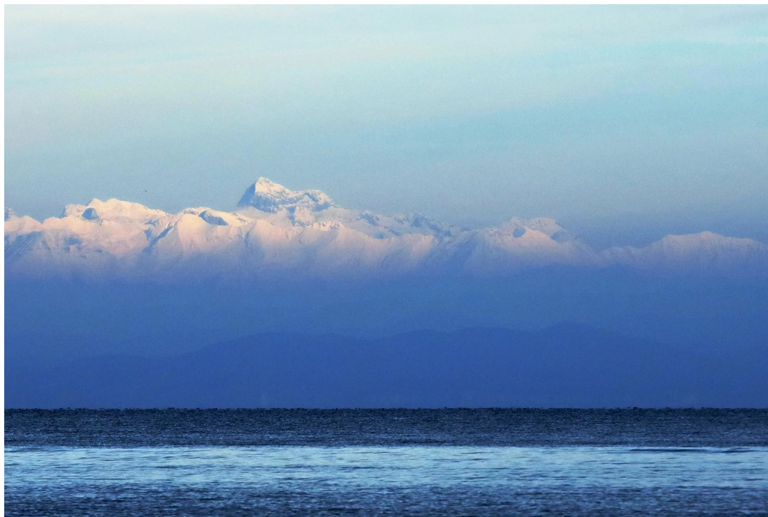
Savudrija, Hrvaška. Piranski zaliv ANDREJ PETELINŠEK

Arbitražno sodišče je v vmesni sodbi povedalo, da kršitev, ki sta si jo privoščila Sekolec in Drenikova, ni bila tako huda, da ne bi nadaljevalo delo, in pred dvema letoma in pol sprejelo tudi končne razsodbe o poteku meje med državama. Ker Hrvaška zavrača njeno implementacijo, je Slovenija sprožila tožbo pred Sodiščem EU v Luksemburgu, kjer toži Hrvaško zaradi kršenja evropskega prava. Slovenija ob tožbi bridko spoznava, da je vladavina prava v EU skoraj mrtva črka na