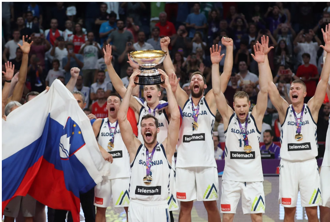
Edina fotografija, ki ne potrebuje komentarja. Turčija. Finale. Eurobasket. 2017

"Kdor ne skače, ni Sloven'c!" družno vpijemo v svetovnih arenah. Potem pride december, ko je treba za športnika leta nehvaležno izbrati le enega najboljšega. In se radi skregamo, kaj je več, posamična ali timska trofeja, medalja v športu, ki se ga "resno gre šest držav", ali četrto mesto v športu, ki ga žgejo od Ria do Moskve. A če podvige izmerimo z najbrž najbolj merodajnim metrom, olimpijsko medaljo, je za slovenskim športom dekada, v kateri je šlo le še navzgor: 21 medalj smo