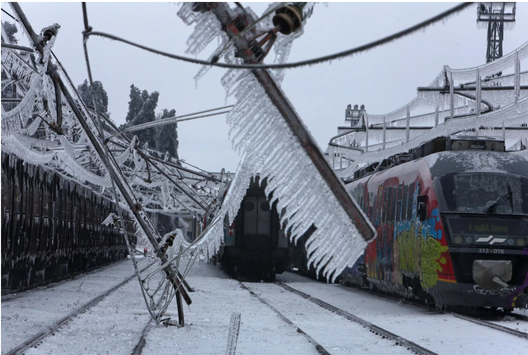
Andrej Petelinšek Apokaliptični prizori iz leta 2014. Železniška postaja Pivka

Potem ko sta bila njuna dečka tri mesece po smrti matere nastanjena pri babici in dedku, ju je marca 2016 velenjski CSD iz vrtca odpeljal v rejniško družino, kjer sta še danes. O vprašanju skrbnikov koroških dečkov sedaj odloča sodišče. Ustavno sodišče je septembra razveljavilo sodbo mariborskega upravnega sodišča, ki je odločilo, da ne bi bilo v največjo korist, če bi dečka odraščala pri babici in dedku. Ustavni sodniki pa so njegovo sodbo razveljavili in odločili, da mora upravno sodišče glede tega vprašati še kolizijskega skrbnika, ki bdi nad pravicami otrok v posebnih primerih.