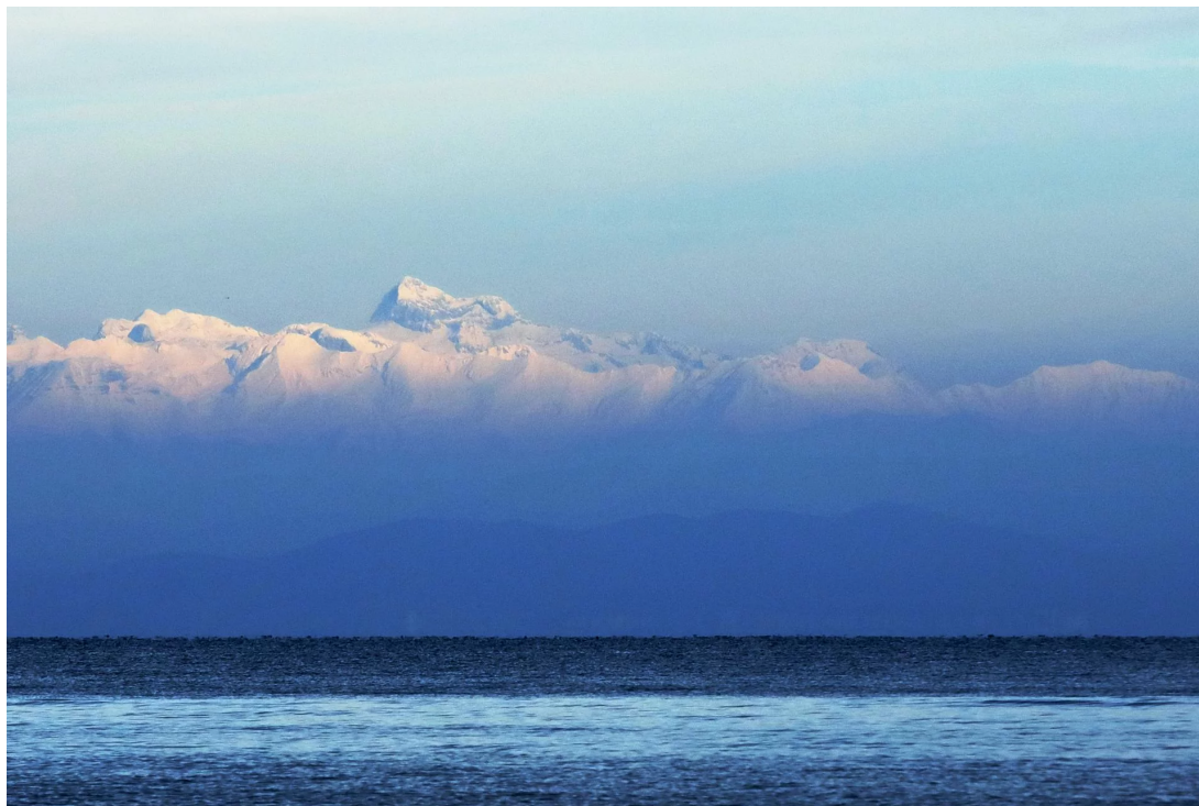
Savudrija, Hrvaška. Piranski zaliv