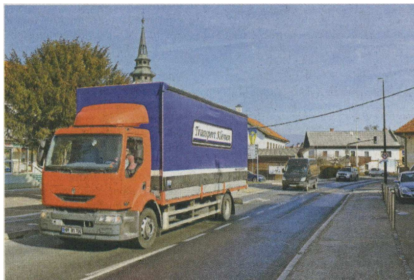
Promet skozi središče Vodice se iz dneva v dan povečuje. Zato občani zahtevajo čimprejšnjo zgraditev obljubljenе obvoznice.