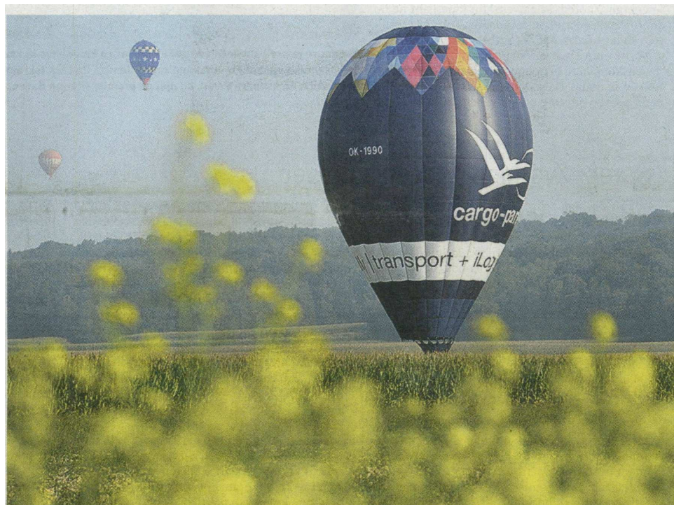
Vprašanje, kako bodo zarisane pomurske meje, ostaja v zraku. Kot baloni državnega prvenstva v letenju, ki ta teden krasijo pomursko nebo. Več o tekmovanju sicer na športnih straneh.

Osnovno šolstvo in vrtci ostajajo po predlogu v pristojnosti občin. Se pa prenašajo ustanoviteljske pravice in obveznosti s področja srednjega in višjega šolstva, zavodov, socialnega varstva, zdravstva (zdravstveni domovi in splošne bolnišnice) kot tudi s področja kulture (muzeji, galerije, gledališča). Zakon podrobneje ne govori o zagotavljanju finančnih virov za delovanje omenjenih ustanov. Razumljivo je, da se sorazmerni delež, ki ga sedaj namenja država za omenjene naloge, prenese z ministrstev na pokrajine. Po oceni poznavalcev pa bi zakon le moral opredeliti stalen vir financiranja za opravljanje nalog na dolgi rok. S podzakonskimi akti – uredbami – je mogoče urediti le prenos sredstev, ki jih država trenutno namenja za delovanje javnih služb. Če bi šli v smeri, da bodo ministrstva zagotavljala denar za delova-