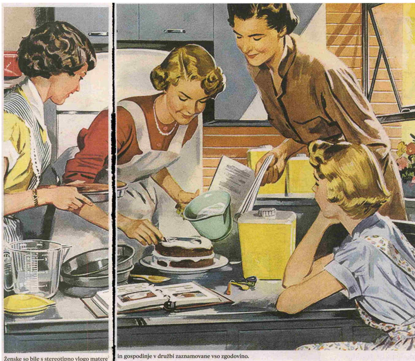
Ženske so bile s stereotipno vlogo matere