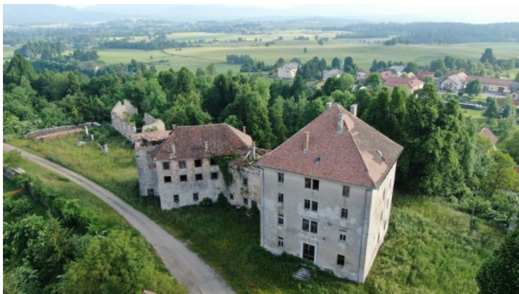
Grad Orehek

Orehek – V športno-kulturnem društvu in krajevni skupnosti Orehek so 24. oktobra pripravili predavanje o podobah in pomenu gradu Orehek, ki je, kljub temu da je preživel turške vpade in obe svetovni vojni, prepušen neslavnemu propadanju. V goste so povabili arhitekta in umetnostnega zgodovinarja dr. Igorja Sapača s fakultete za gradbeništvo , prometno inženirstvo in arhitekturo v Mariboru.