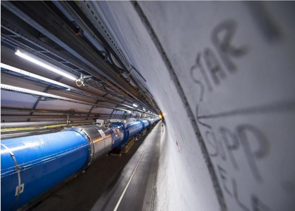
Veliki hadronski trkalnik

elektronike in radijske frekvence, informacijskih tehnologij, strojništva in surovin, vakuuma in nizkih temperatur, detektorjev delcev in fotonov, optike in fotonike, plinov, kemikalij in sevalne opreme, zdravja, varnosti in okolja, prevoza, skladiščenja in vozil, pisarniške dobave, pohištva, komunikacije in usposabljanj ter izvajanja storitev na lokaciji CERN.