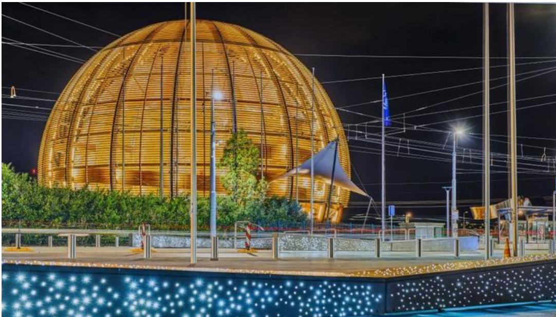
Esplanade des Particules de nuit

CERN – Evropska organizacija za jedrske raziskave - je največji laboratorij za fiziko delcev in sodi med najbolj elitne znanstvene institucije na svetu. Pridruženo članstvo Republike Slovenije v tej organizaciji nudi vrsto poslovnih in razvojnih priložnosti tudi slovenskemu gospodarstvu.