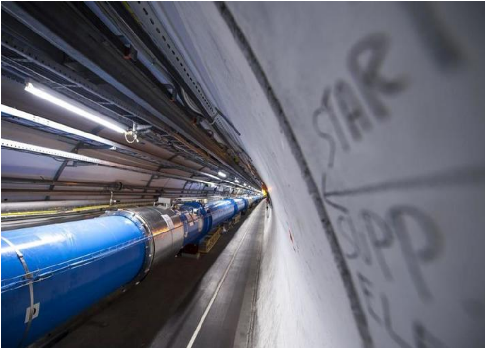
Veliki hadronski trkalnik

elektronike in radijske frekvence, informacijskih tehnologij, strojništva in surovin, vakuumu in nizkih temperatur, detektorjev delcev in fotonov, optike in fotonike, plinov, kemikalij in sevalne opreme, zdravja, varnosti in okolja, prevoza, skladiščenja in vozil, pisarniške dobave, pohištva, komunikacije in usposabljanj ter izvajanja storitev na lokaciji CERN.