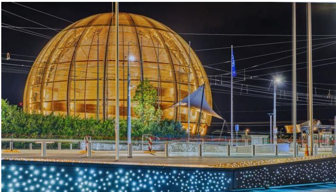
Esplanade des Particules de nuit

CERN – Evropska organizacija za jedrske raziskave - je največji laboratorij za fiziko delcev in sodi med najbolj elitne znanstvene institucije na svetu. Pridruženo članstvo Republike Slovenije v tej organizaciji nudi vrsto poslovnih in razvojnih priložnosti tudi slovenskemu gospodarstvu.