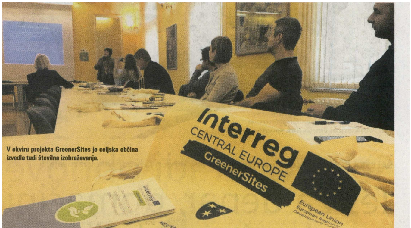
V okviru projekta GreenerSites je celjska občina izvedla tudi številna izobraževanja.

Pilotno metodo je zasnoval in izvedel Kmetijski inštitut Slovenije. Aktivni substrat je pripravil iz komposta, mineralnih tal in mineralov zeolita, ki vežejo težke kovine.