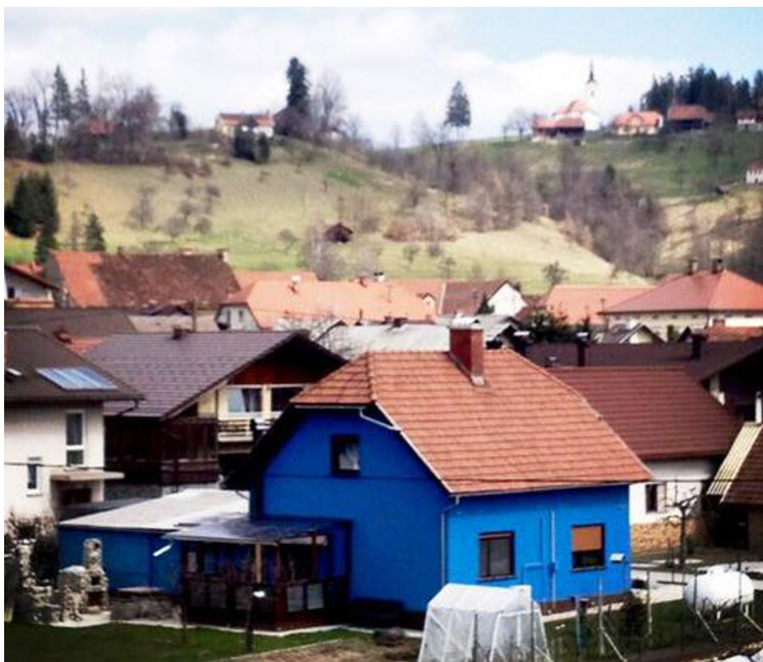
50 OD TENKOV SLOVENSkih FASAD

stavbne dediščine, ki ne vpliva le na prebivalce hiše, temveč na vso okolico. Priča o neki kulturi oziroma pomanjkanju te, o pomanjkanju likovnega okusa in neskončni brezbržnosti lastnika hiše.