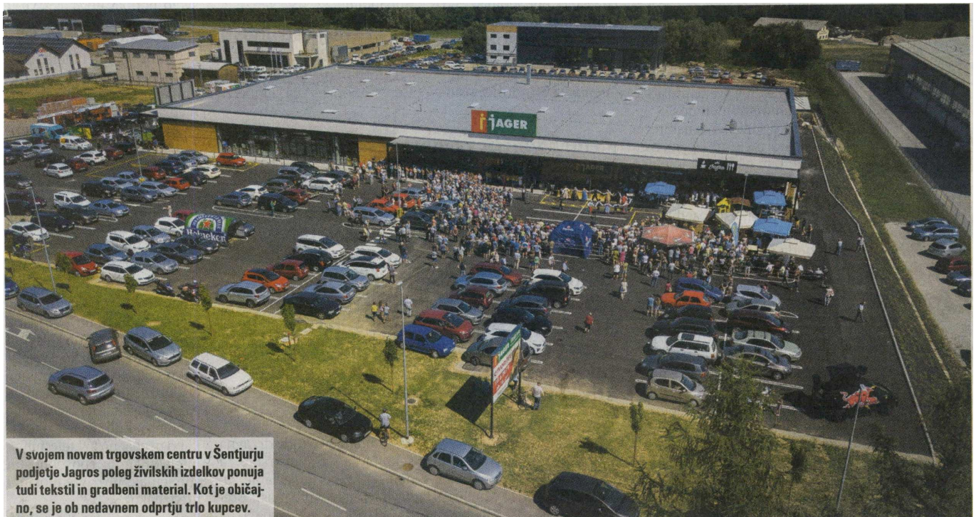
V svojem novem trgovskem centru v Šentjurju podjetje Jagros poleg živilskih izdelkov ponuja tudi tekstil in gradbeni material. Kot je običajno, se je ob nedavnem odprtju trlo kupcev.