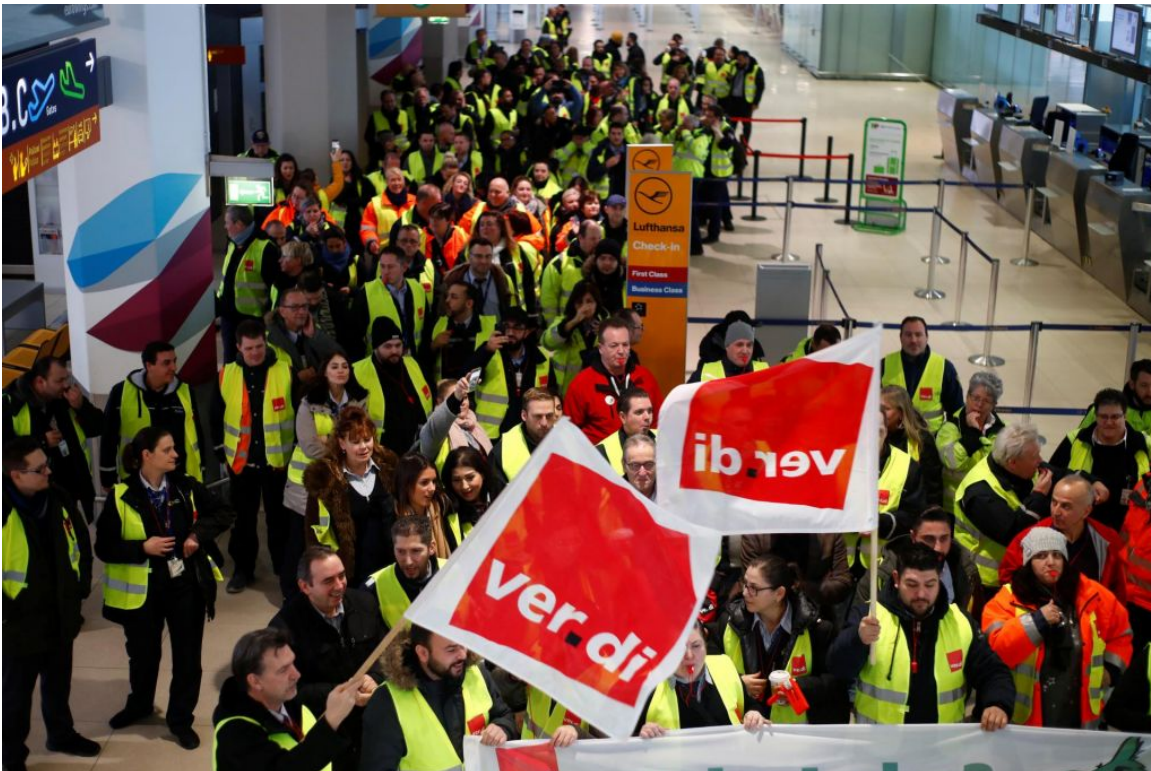
Nemški delavci so letos s številnimi stavkami v različnih panogah zahtevali in tudi dosegli zvišanja plač.