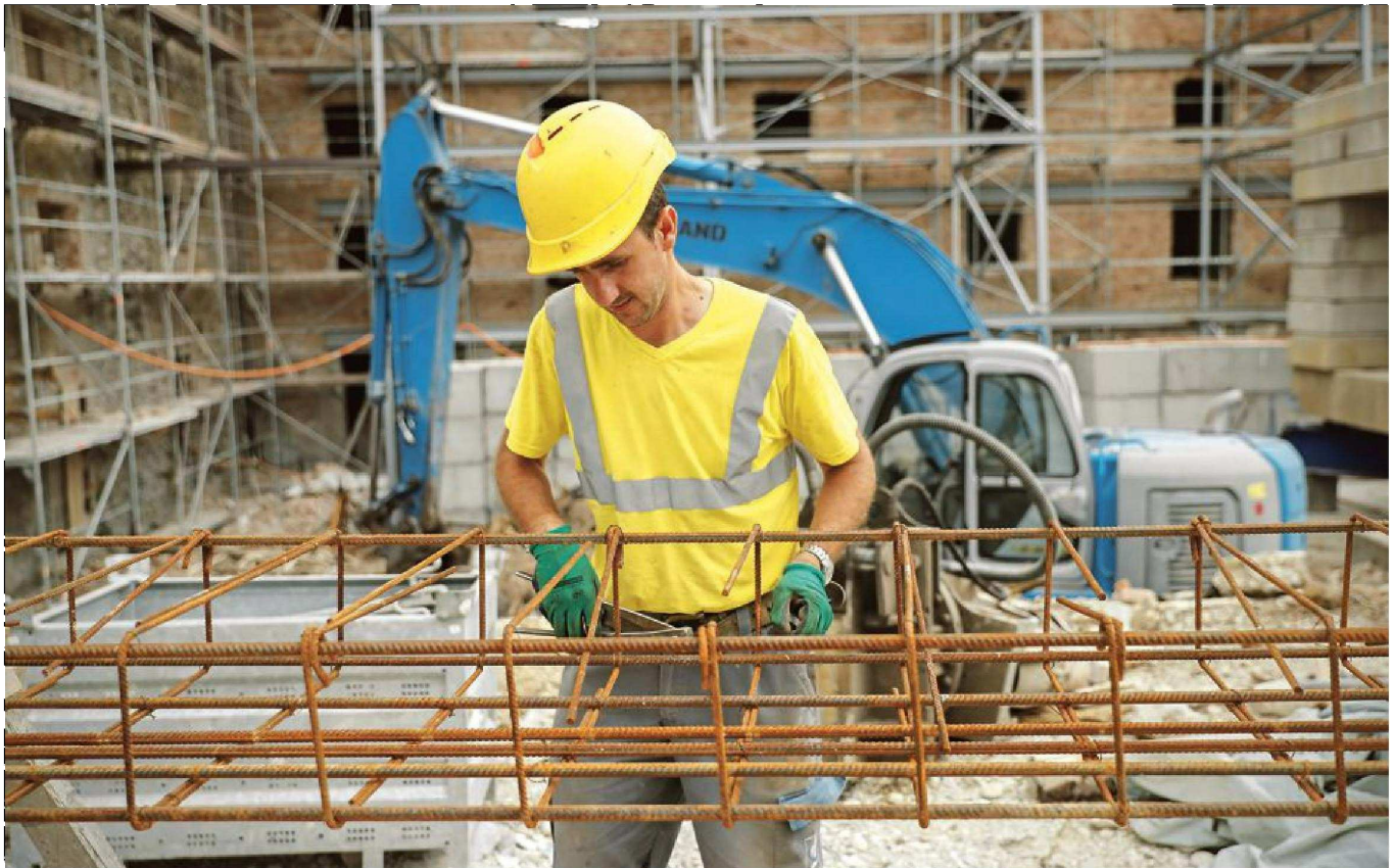
Letos aprila je bilo v gradbeništvu zaposlenih 63.535 ljudi, kar je dobrih deset odstotkov več kot lani v istem mesecu.