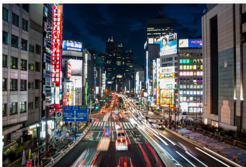
Japonska se že dolgo sooča s problemom starajočega se prebivalstva.

Po poročanju Nikkei Asian Review bo japonska vlada pripravila proračun v višini 100 milijard jenov (841 milijonov evrov), s katerim nameravajo v Tokio privabiti raziskovalce iz Japonske in ostalih držav, ki bi se lotili reševanja njihovih težav. Japonska vlada je začrtala 25 področij , za katera bodo namenili raziskovalna sredstva. Raziskovalne projekte bodo podpirali deset let, trenutni proračun pa naj bi služil za prvih pet let.