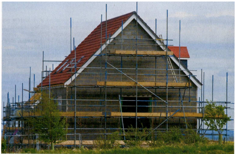
Kapo dol, če se gradnje hiše lotite sami.

Večina ljudi se gradnje hiše v resnici ne loti sama, saj ne premore potrebnega znanja. Tudi če je investitor sam kvalificiran za gradnjo, morajo določena dela izpeljati strokovnjaki. Treba je izbrati še izvajalce različnih del, to je za investitorja