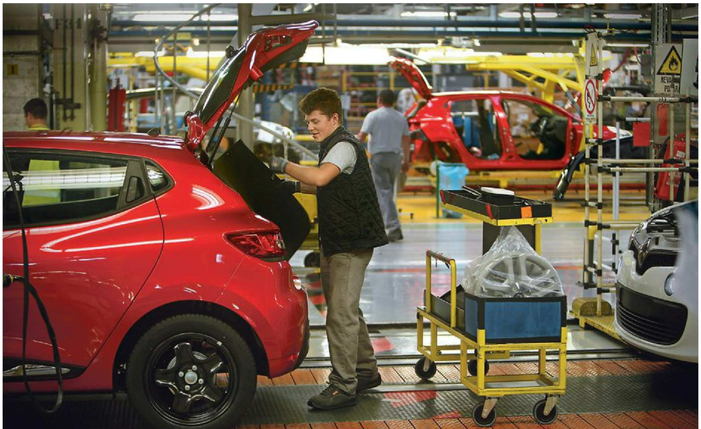
Novomeški Revoz je ohranil prvo mesto na lestvici izvoznikov, na tuje je prodal za več kot 1,7 milijarde evrov avtomobilov.