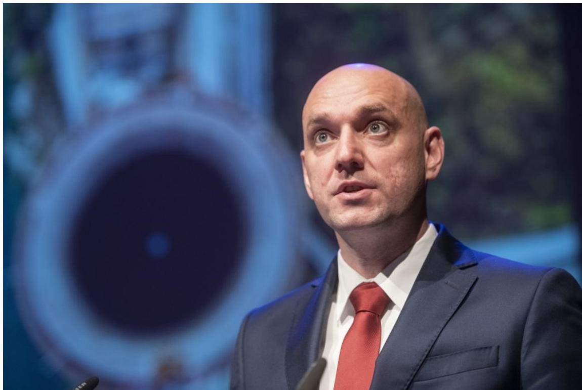
Okoljski minister Simon Zajc.

torek, 07 maj 2019 10:55 Napisal Andrej Žitnik Comments:0 Komentarjev