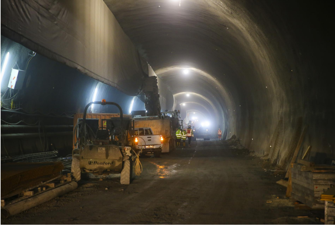
Gradnja druge cevi predora Karavanke na avstrijski strani.

Pomemben investitor je tudi Dars, ki vsako leto razpisuje posle za več deset kilometrov rekonstrukcij avtocest in hitrih cest ter viaduktov in predorov; lani za 153 milijonov evrov. Pred vrati pa sta še omenjena velika projekta: druga cev predora Karavanke in tretja razvojna os.