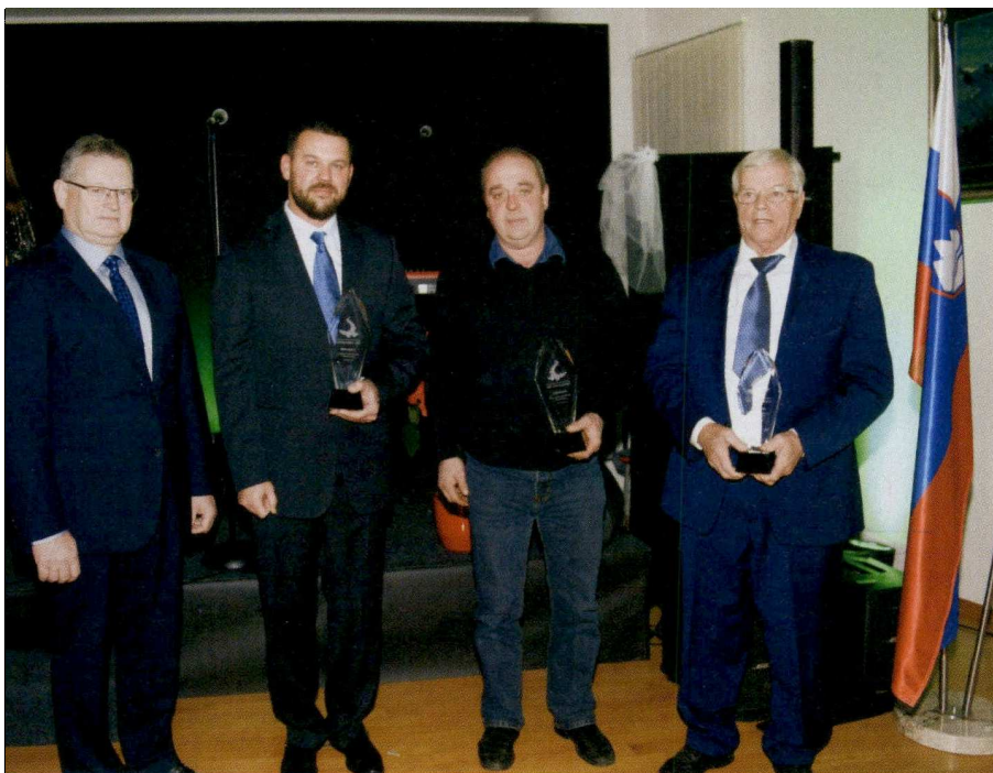
Prejemniki priznanj Barjanec, ki jih je podelila OOO Ljubljana Vič.

Nedavno je Območna obrtno-podjetniška zbornica Ljubljana Vič praznovala deseto obletnico odprtja nove poslovne stavbe zbornice in že desetič po vrsti trem članom – najzaslužnejšim obrtnikom in podjetnikom podelila priznanje Barjanec. Podelitev Barjanca je spodbuda za vse da pomagajo drugim in se zavedajo svoje družbene odgovornosti.