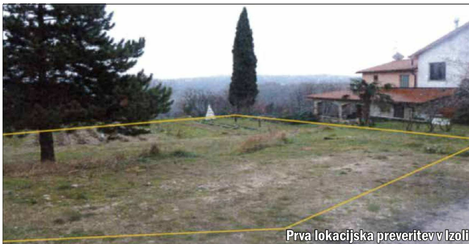
Prva lokacijska preveritev v Izoli

- Zeleni pas omejuje na zahodu hudournik Morer, na vzhodu pa predvidena dostavna/servisna cesta. Na tem območju se s spremembami na območju zelenih površin predvidijo javni (mestni) vrtovi, v okviru katerih se predvidi tudi postavitev enostavnih objektov in nezahtevnih objektov.