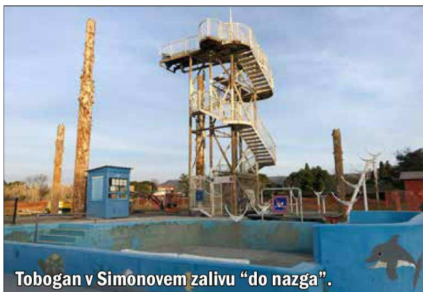
Tobogan v Simonovem zalivu "do nazga".

Pri obravnavi sprememb pravilnika o oglaševanju so menda razmišljali o znižanju kazni za fizične osebe in predlagali, naj se določijo mesta, kjer lahko izolski občani ali društva brezplačno obesijo letake, seveda v skladu z našim odlokom.