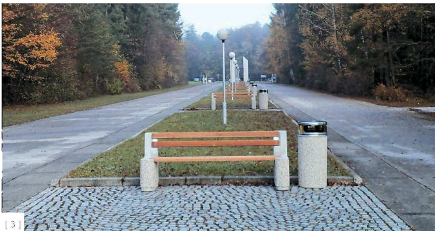
[ 3 ]

Že oče je postavil poslovanje tako, da so se bolj osredotočali na kakovost kot na količino. Njihovi izdelki so bili zato nekoliko dražji kot tisti v megamarketih, a so bili boljši. Danes se Štubrovi dobro zavedajo pomena modernizacije proizvodnje in uvajanja novih materialov; poleg rečnega proda iz Soče so začeli uporabljati denimo pohorski tonalit. Nedavno so posodobili celotno grafično podobo podjetja, ob širokem spektru proizvodnega programa pa nenehno razvijajo nove izdelke in uspešno sodelujejo z arhitekti. Tako je bil denimo njihov pitnik Pisa, ki je nastal v sodelovanju s Studiom CD - oblikovalcema Dragom Cerjanom , u.d.i.a., in Matejem Borinom , u.d.i.a., razstavljen na 18. Bienalu industrijskega oblikovanja v Ljubljani. In letos so naredili še prav posebno klop, projekt akademske kiparke Vlaste