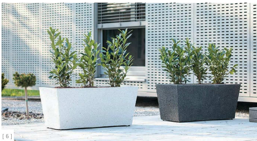
[ 6 ]

Cobal Sedmak. Na desnem bregu Drave omogoča pogled na Staro trto in je nova mestna pridobitev iz serije Zgodbe o klopeh in ljudeh. Ne preseneča, da je podjetje Kremen za kakovost svojih izdelkov prejelo srebrni ceh Obrtne zbornice Slovenije.