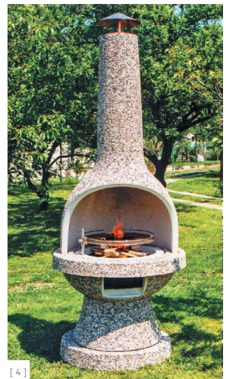
[ 4 ]

Les, ki ga uporabijo za klopi v programu urbane opreme, je prav tako zelo premišljeno izbran. "Smreka prihaja iz domačih logov in se - obdelana z oljem - obnese bolje, kot bi mnogi mislili," pove Jure Štuber. Tropiski les uvažajo neposredno iz Brazilije, kjer ga zanje oblikujejo na zeleni profil in mero, ki jo potrebujejo v Melju. Enako velja za sibirski macesen, ki ga prav tako uvažajo neposredno od tam, kjer raste – iz ruske severne Azije. "Ni naključij," so prepričani v podjetju Kremen, "za odličen izdelek mora biti že material odličen."