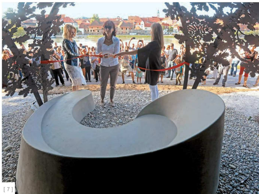
[ 7 ]