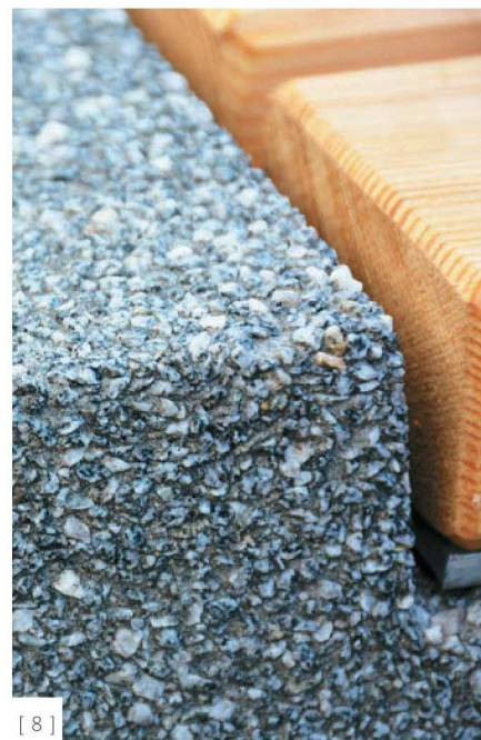
[ 8 ]