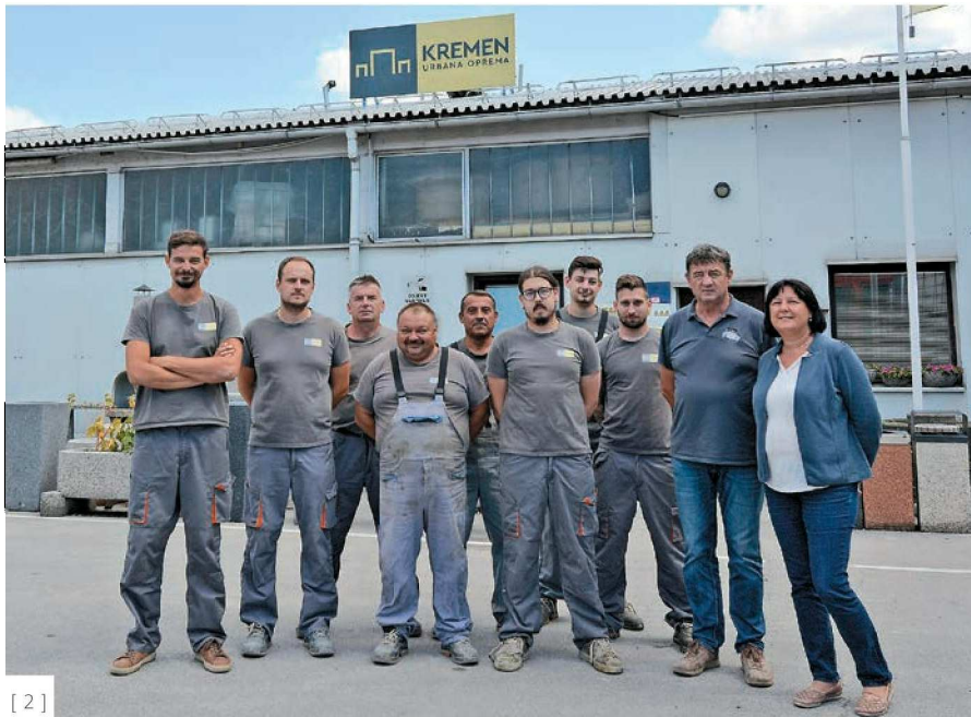
[ 2 ]