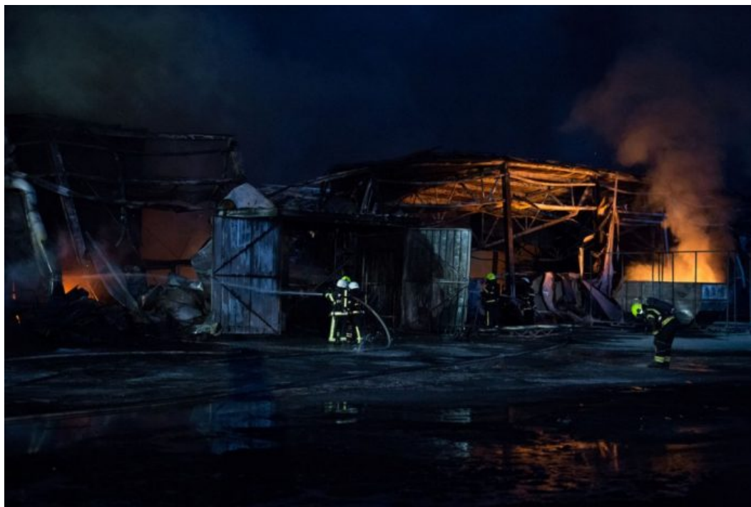
Požar v IC Podskrajnik

Cerknica, regija – Obračamo zadnji list letošnjega leta; zgodilo se je veliko dogodkov, ki bi se jih radi spominjali, saj so bogatili naša življenja, jih osmislili, včasih pa samo poskrbeli za to, da so kvalitetnejša. Zadnji prispevki letošnjega leta – nadaljevali bomo z njimi tudi v prve dni novega -, bodo namenjeni pogledu nazaj. V letu, ki se izteka, smo na portalu Notranjsko-primorskih novic objavili preko 1200 prispevkov, pretežno avtorskih in predvsem iz regije. Nekaterih, ki ste jim bralci namenili posebno pozornost, se bomo v pregledu spomnili še enkrat. Iz uredništva novic vsem voščimo prijetne praznike in srečno v letu 2020!