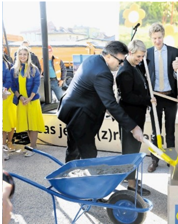
Ikea začela graditi trgovino v Ljubljani

Ob vstopu v novo leto smo pripravili pregled dogodkov, ki so zaznamovali Ljubljano v letu 2019. Tudi to leto je bilo v znamenju gradbenih del, podatkov o čedalje dražjih nepremičninah in domnevnih nezakonitostih, v katere naj bi bil vpleten župan.