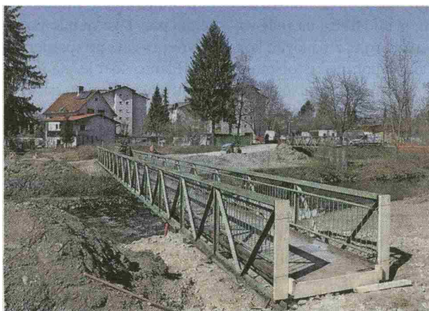
Stari most so začasno prestavili, da je prehod čez reko na tem mestu še vedno možen.

obvestila in smerokaze, ki so nameščeni na ustreznih mestih. Gradbišče bo na mestu, kjer je bil postavljen star most, zaprto,« sporočajo z občinske uprave. Namesto starega mostu bodo postavili novega, ki je zasnovan sodobno in bo širši kot stari, zato bo poleg pešcem in kolesarjem občasno namenjen tudi intervencijskim vozilom z omejeno težo. Dela bodo predvidoma izvajali do avgusta letos, poseg v samo strugo pa bodo izvedli v času, ko ne bodo ovirali drstenja rib in mrestenja dvoživk.