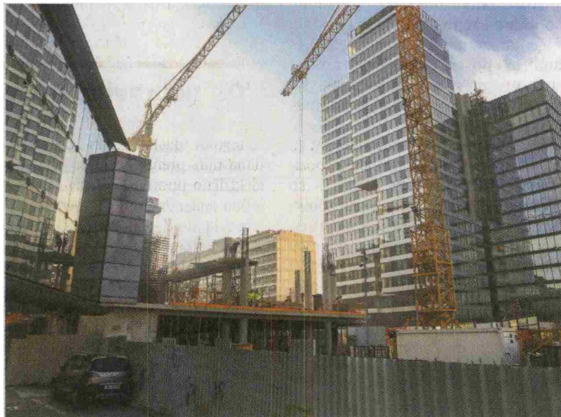
Če bodo postopki za pridobitev gradbenih dovoljenj stali predolgo, si bo gradbeništvo opomoglo z veliko zamudo.