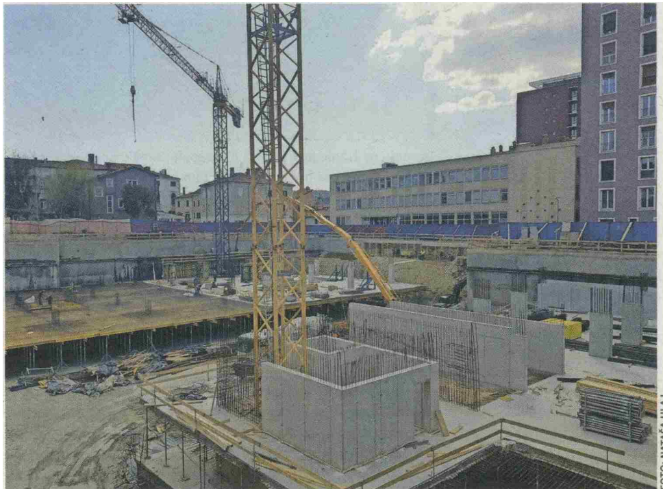
Šest milijonov evrov vredna naložba Mestne občine Koper v garažno hišo zaenkrat še ni zastala.

V Gospodarski zbornici Slovenije ugotavljajo, da so odgovorna podjetja znižala število prisotnih na gradbiščih, zmanjšala obseg dela, uvedla stroga pravila obnašanja zaposlenih, določila postopke razdeljevanja prehrane ter uporabe skupnih sanitarij. V tej panogi dela več kot 65.000 zaposlenih in je izjemno pomemben zaposlovalec, še poudarjajo v gospodarski zbornici.