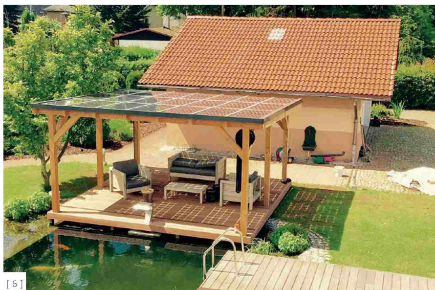
[ 6 ]

[ 6 ] Cene energije na energetskem trgu so izpostavljene velikim nihanjem glede na različna politična, ekonomska in tudi naravna tveganja. Če imate lastne vire električne energije, boste morebitnim nenadnim dvigom cen bistveno manj izpostavljeni.