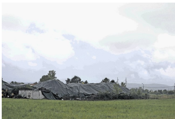
Potem ko so povzdignili glas prebivalci Zaloga in okoljevarstveniki, je podjetje ML surovine pokrilo pepel in žlindro.

Okoljska inšpekcija preverja, ali podjetje ML Surovine, ki v Zalogu začasno skladišči pepel in žlindro iz ljubljanske toplarne, deluje v skladu s predpisi. Pred dnevi je podjetje odpadke skladiščilo na prostem, čeprav dovoljenja za to nima.