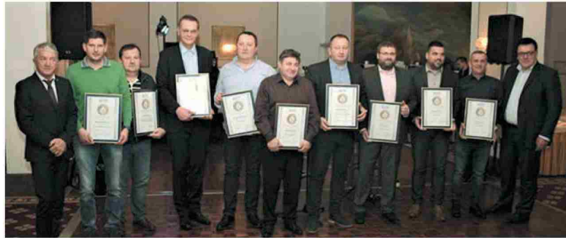
Prejemniki znaka odličnosti v gradbeništvu