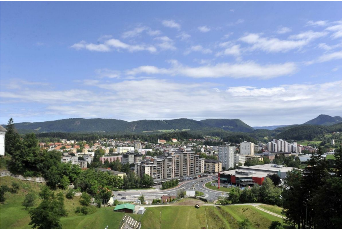
Območna služba zavoda Velenje je januarja porast zaznala tudi medletno.

Med novoprijavljenimi je bilo 7159 brezposelnih zaradi izteka zaposlitev za določen čas, 695 iskalcev prve zaposlitve in 1948 trajno presežnih delavcev oz. stečajnikov. Od 6739 brezposelnih, ki jih je januarja zavod odjavil iz evidence, se je zaposlilo oziroma samozaposlilo 4700 oseb, kar je 46,4 odstotka več kot decembra in 11,7 odstotka manj kot januarja lani.