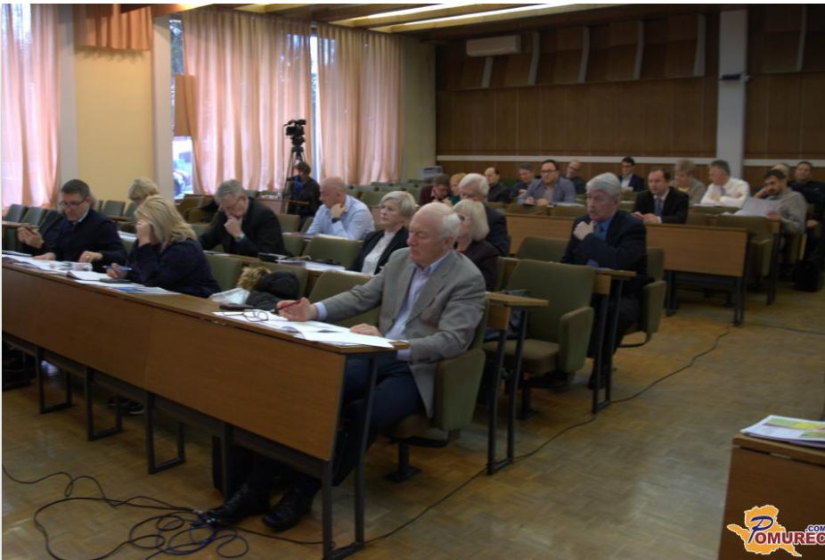
FOTO: V Murski Soboti bodo na voljo nove gradbene parcele