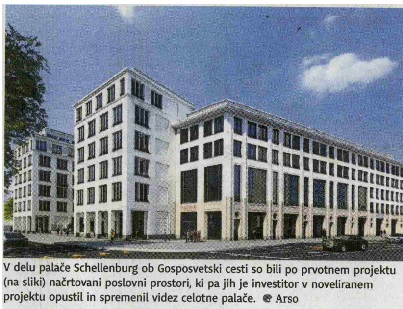
V delu palače Schellenburg ob Gosposvetski cesti so bili po prvotnem projektu (na sliki) načrtovani poslovni prostori, ki pa jih je investitor v noveliranem projektu opustil in spremenil videz celotne palače. ● Arso