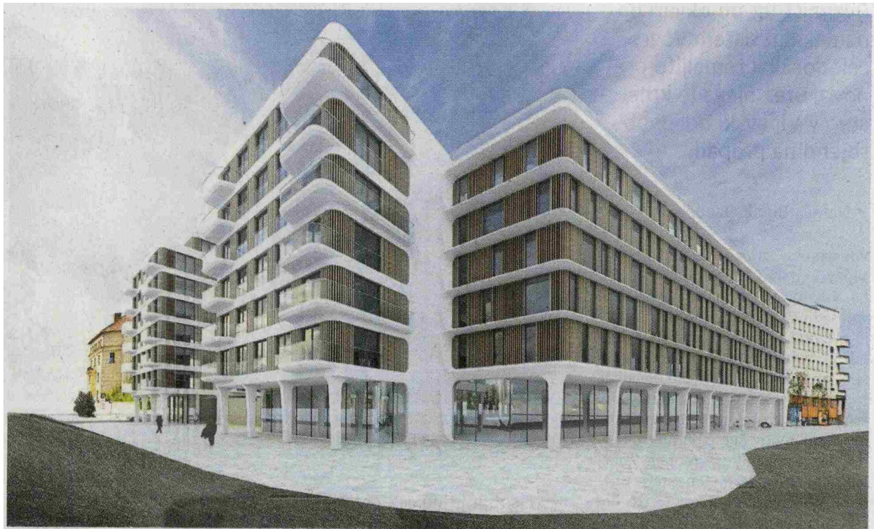
Po spremembi Reitenburgovega projekta na območju nekdanjega Kolizeja je biro API arhitekti pripravil novo vizualizacijo načrtovane palače Schellenburg. ● API arhitekti