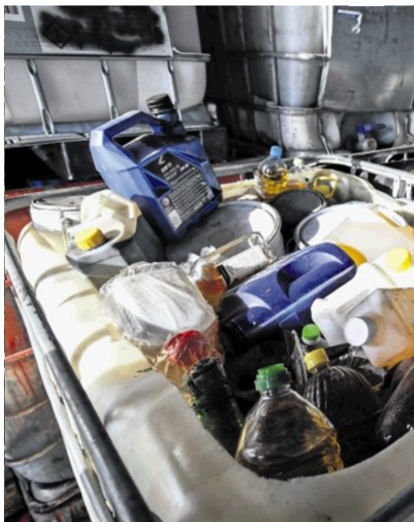
Kemis bo kljub prepovedi še naprej obratoval.

Iz vodstva Kemisa so sporočili, da ne bodo spoštovali odločbe gradbene inšpekcije. Ta je vse tri sporne objekte vrhniškega predelovalca odpadkov razglasila za nelegalne. Že pred časom je odločila, da je črna gradnja zalogovnik za požarno vodo