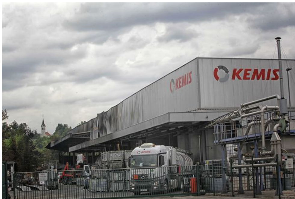
V Kemisu so se odločili, da odločbe okoljskega inšpektorata ne bodo upoštevali.

Pred dnevi je inšpekcija dodatno ugotovila, da je črna gradnja tudi odprta nadstrešnica za skladiščenje odpadkov (objekt A), medtem ko prizidek (objekt B) k njej nima uporabnega dovoljenja. Kot so povedali odvetniki vrhniške občine, odločba za oba objekta nalaga takojšnje prenehanje opravljanja dejavnosti, za prvega pa tudi rušitev v roku leta dni.