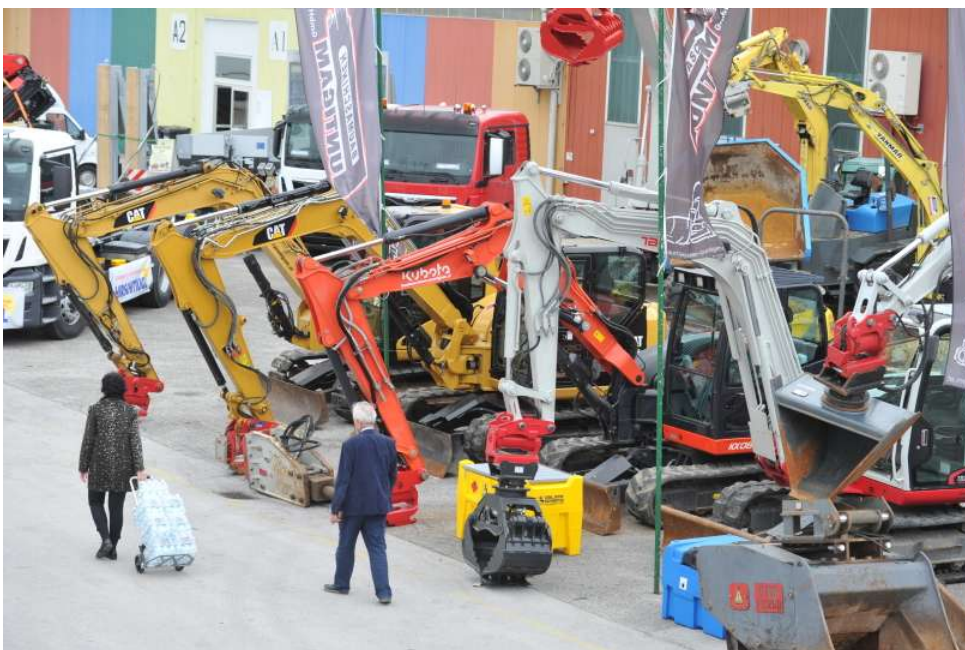
Nataša Juhnov Megra (slika je simbolična)