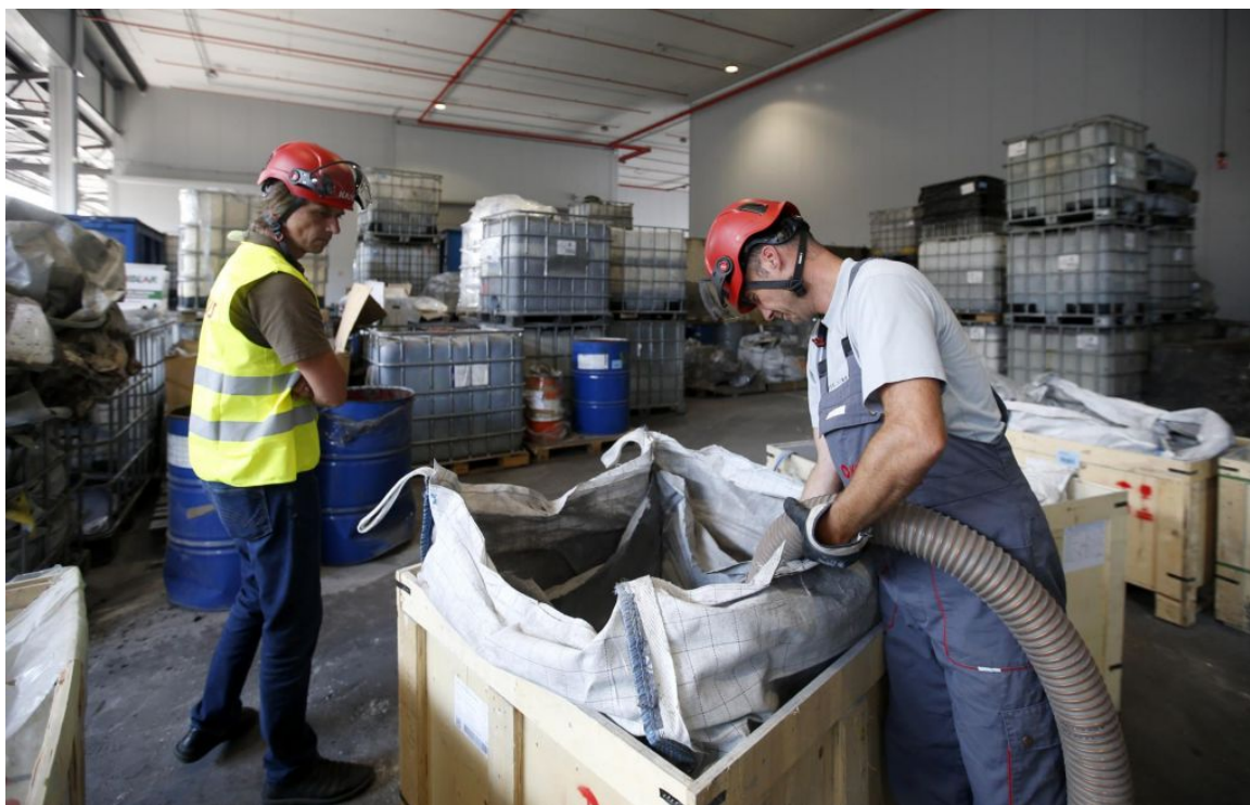
Inšpektorji zahtevajo rušenje glavne stavbe.