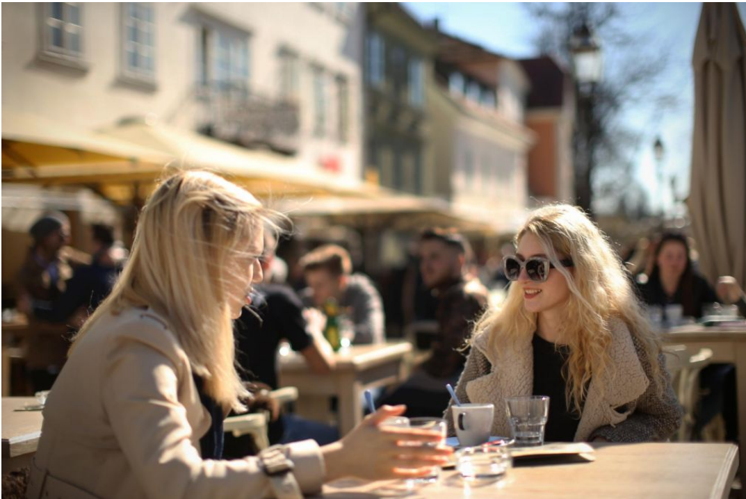
Trend naraščanja zaposlitvenih namer, ki smo mu bili priča v zadnjih treh letih, se umirja.