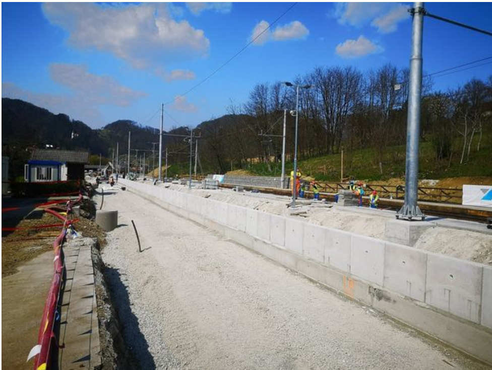
Nadgradnja železniške postaje Zidani most - Celje.

"Če želimo slediti ciljem evropskega zelenega dogovora, potrebujemo močnejšo in boljšo železniško infrastrukturo. Pri investicijah se vse začne in konča pri denarju. Zato bo treba v prihodnosti razmisliti o načinih, kako učinkovito nameniti namenska sredstva za gradnjo železniške infrastrukture," je dejal minister.