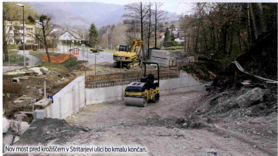
Nov most pred krožiščem v Stritarjevi ulici bo kmalu končan.