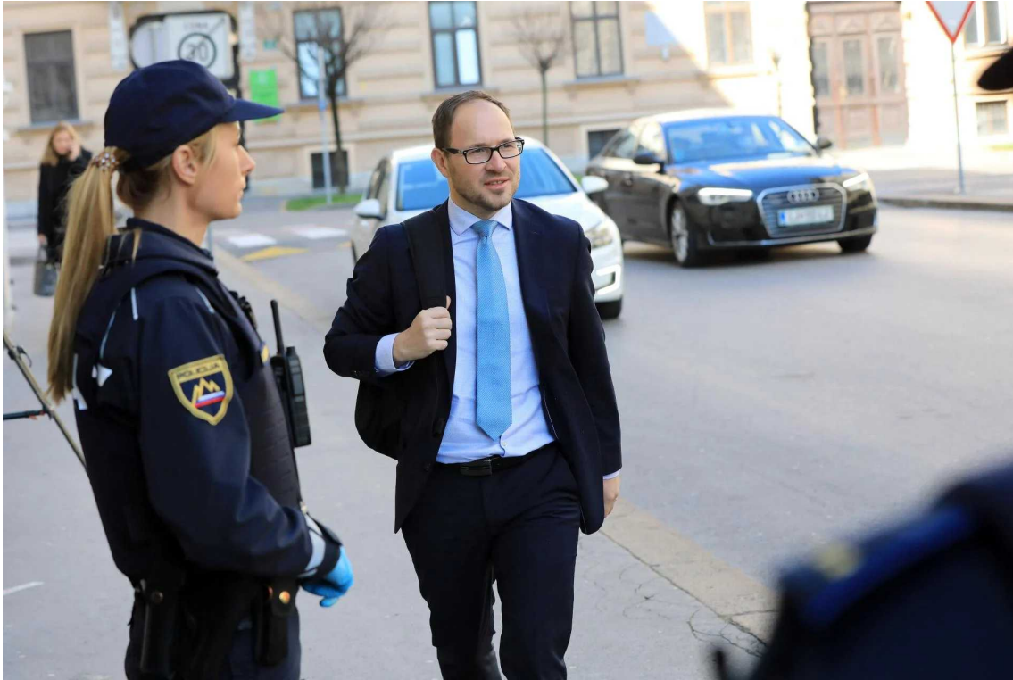
Minister Jernej Vrtovec: "Želim si, da zaradi tožbe ne bo dodatnih zamud pri projektu in izgradnji tega dela tretje osi."

Ker je postopek v teku, vsebine niso želeli komentirati. "O tem, ali tožba zadrži pravomočnost gradbenega dovoljenja, bo odločalo sodišče, saj ROVO ni stranka v postopku predmetnega gradbenega dovoljenja," pa so nam odgovorili v Darsu.