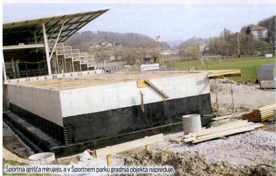
Športna igrišča mirujejo, a v Športnem parku gradnja objekta napreduje.