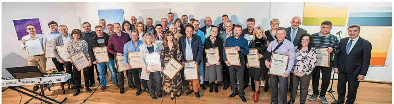
Jubilanti, prejemniki priznanj Območne Obrtno-podjetniške zbornice Krško