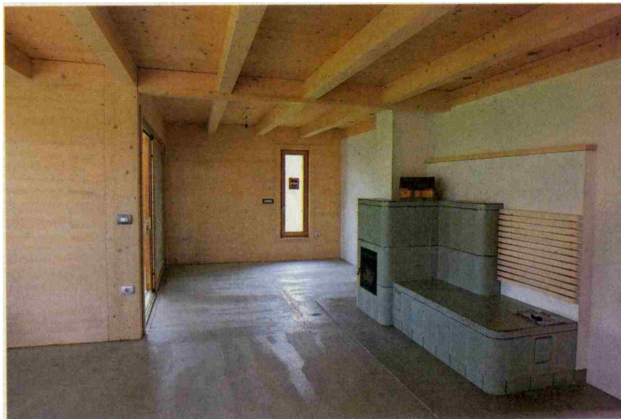
Idealna orientacijska pomoč za vse, ki razmišljajo o novem domu, je obisk dneva odprtih vrat, ki jih organizirajo ponudniki.

In nenazadnje je prav gotovo dobrodošel tudi obisk gradbenega sejma. Kot na primer Sejem DOM (od 4. do 8. marca 2020 v Ljubljani), ki je največji mednarodni sejem gradbeništva pri nas – vsako leto ponudi priložnost razstavljanja več sto ponudni-