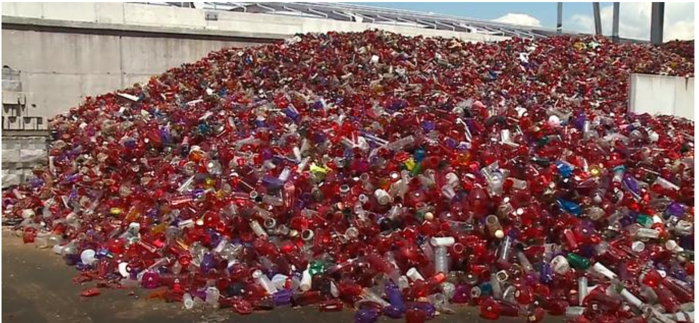
Inšpektorji za okolje bodo v sodelovanju s policijo izvedli tudi akcijo nadzora vožnje v naravnem okolju. Prednostno se bo nadzor izvajal na območjih, ki imajo naravovarstveni status.

V januarju so inšpektorji za okolje že izvedli usmerjeno akcijo ravnanja s komunalno odpadno embalažo pri izvajalcih javnih služb zbiranja komunalnih odpadkov. Ker se je lani pojavil problem nakopičenih količin odpadne električne in elektronske opreme pri izvajalcih javnih služb, pa bo inšpekcija izvedla tudi akcijo nadzora nad petimi nosilci skupnih načrtov glede zbiranja in obdelave te opreme.