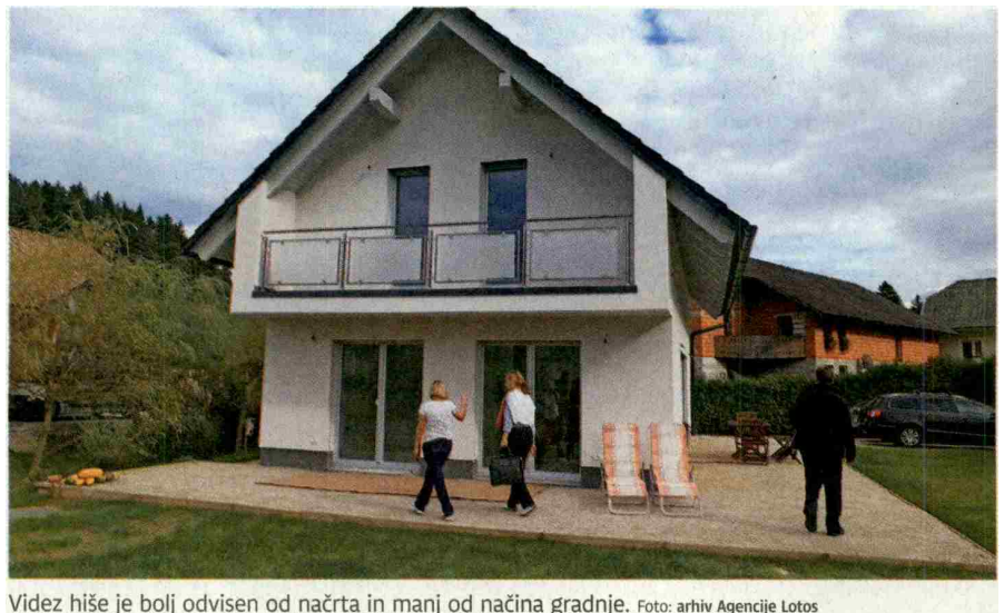
Videz hiše je bolj odvisen od načrta in manj od načina gradnje.

V Sloveniji še vedno predsodki V Sloveniji se še vedno malo kupcev odloča za montažno gradnjo. Verjetno zaradi predsodkov in nepoznavanja prednosti tovrstne gradnje. Dejstvo pa je, da slovenski proizvajalci lesenih montažnih stavb dose-