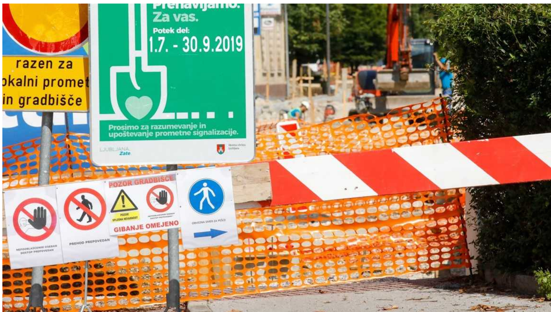
📷 Gradbena inšpekcija bo opravila tudi nazor nad označitvijo in zaščito gradbišč.

Inšpekcije inšpektorata za okolje in prostor bodo letos izvedle najmanj 13.500 inšpekcijskih nadzorov. Več kot 2000 nadzorov bodo opravili v 20 usmerjenih akcijah, so napovedali na inšpektoratu.