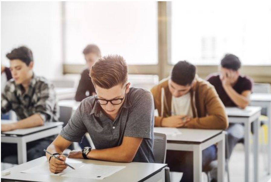
Redki učenci ob prehodu v srednjo šolo že vedo, kaj bi radi počeli po zaključku šolanja.

Na katero šolo se vpisati, da bo moj otrok po končanem šolanju lažje dobil službo? To je vprašanje, ki si ga v teh dneh postavlja marsikateri starš. Trenutno je največ povpraševanja po voznikih tovornjakov, varilcih, prodajalcih, kuharjih, natakarihjih ... A trg dela je v današnji družbi zelo nepredvidljiv in spremenljiv, zato je zelo težko napovedati, kakšne kadrovske potrebe bodo imela podjetja na dolgi rok.