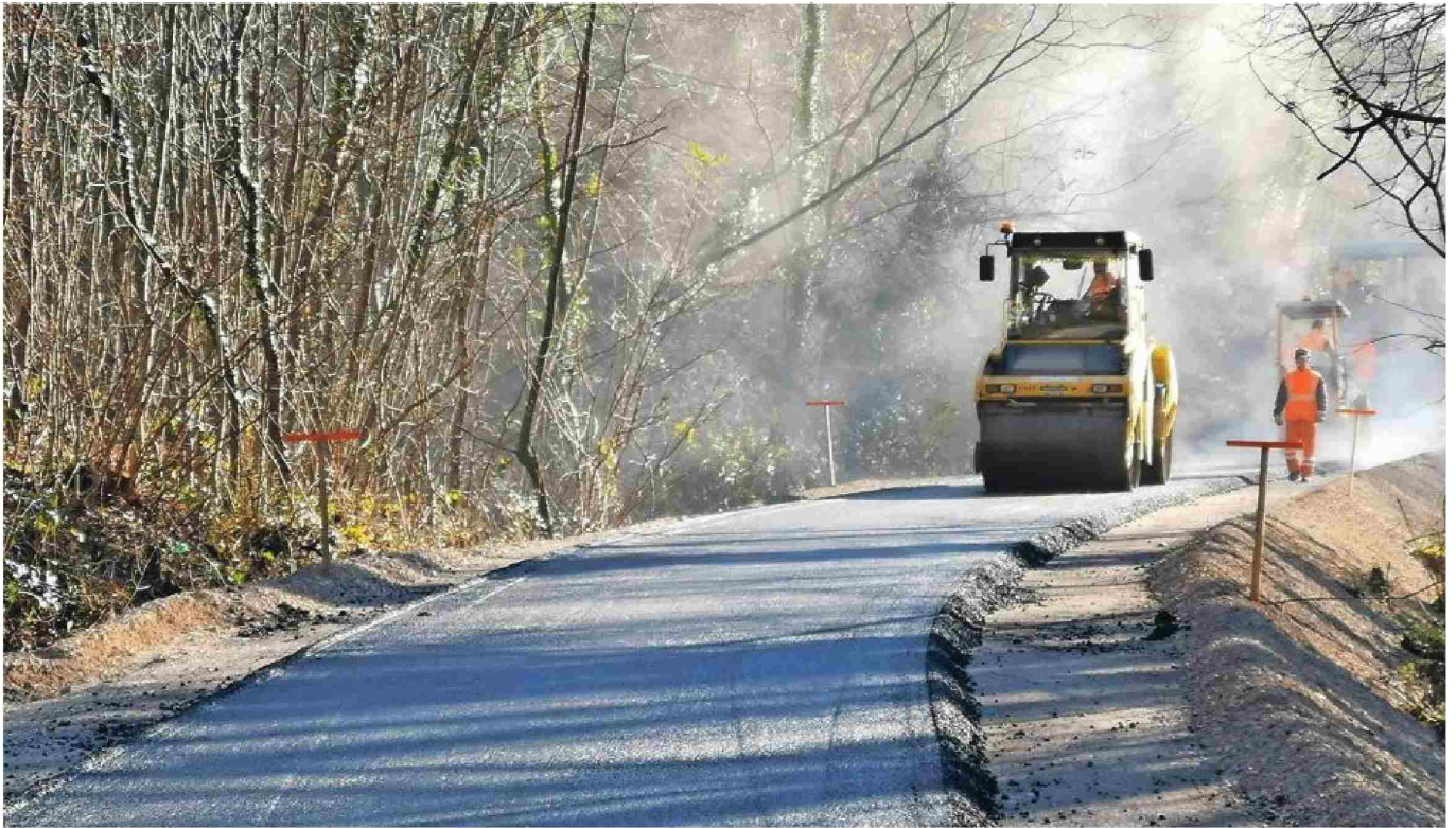
Dostopna cesta v dolini Glinščice je pripravljena, gradnja premostitvenih objektov bi lahko stekla najhitreje marca.