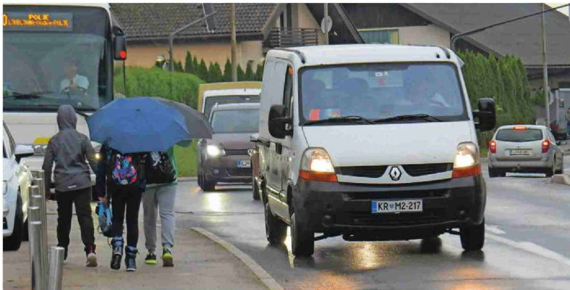
Več kot deset tisoč motornih vozil na dan ogroža prebivalce Vodice.