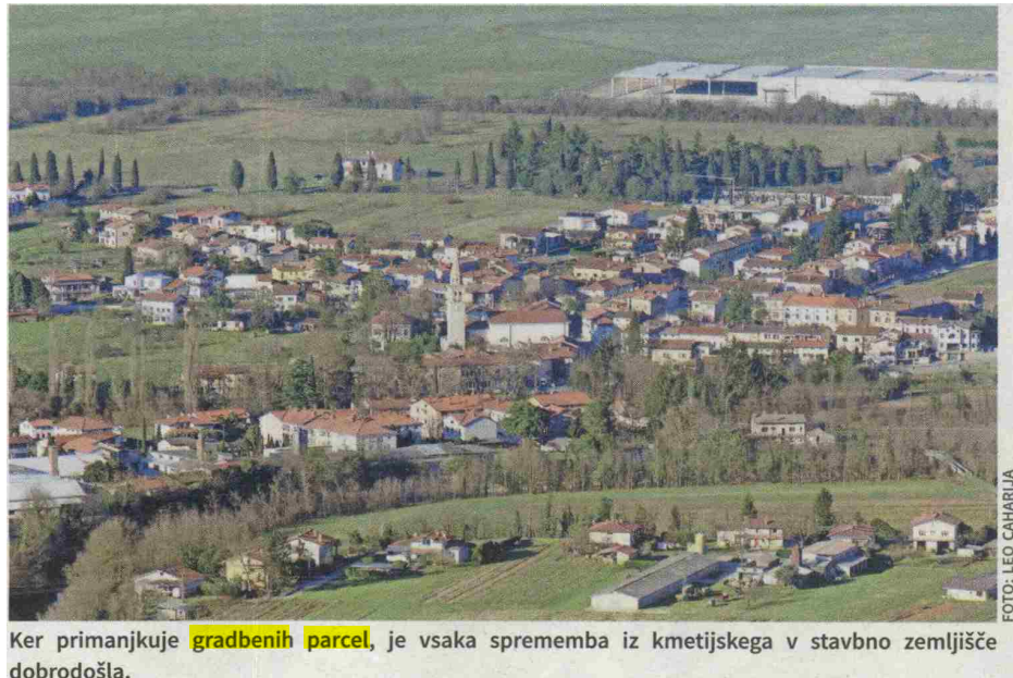
Ker primanjkuje gradbenih parcel , je vsaka sprememba iz kmetijskega v stavbno zemljišče dobrodošla.

Po štirih letih usklajevanj so v občini Miren-Kostanjevica sprejeli dopolnjen in spremenjen občinski prostorski načrt (OPN). Spremembe se nanašajo na namensko rabo prostora. Mnogi bodo zdaj lahko začeli graditi. Prisluhnilni so namreč večini predlogov za spremembo kmetijskega zemljišča v stavbno.