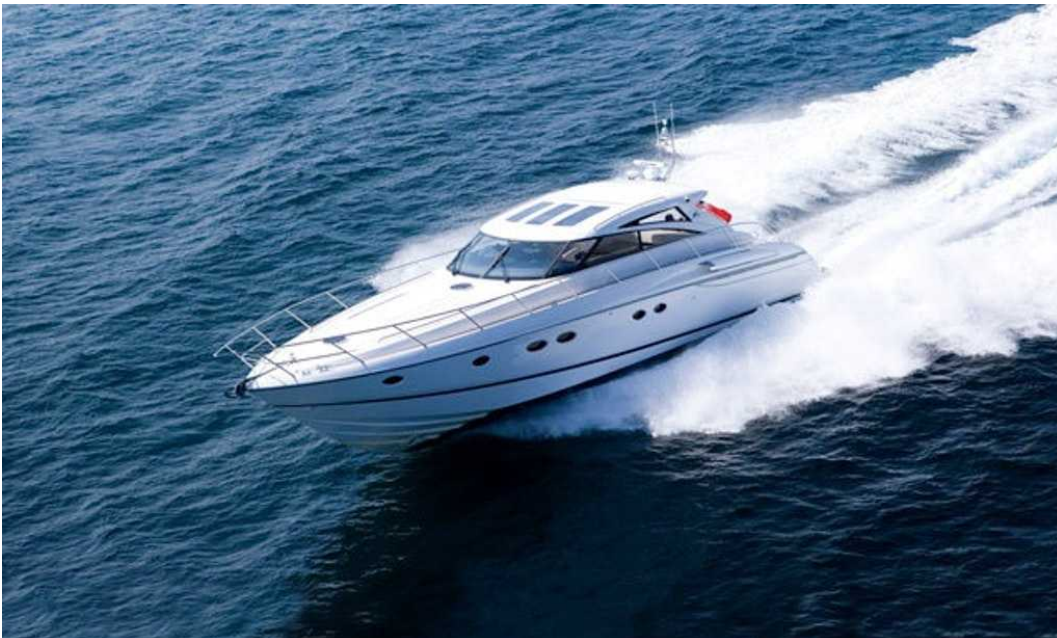
Jahta Devotion II se je (zaenkrat) izognila roki finančne uprave.

Iz finančne uprave so nam sporočili, da so od leta 2014 do 2019 izdali 1857 takšnih vpisov zastavne pravice. Niso pa nam mogli povedati, za kakšno vsoto neplačanih davkov je šlo v teh primerih. Podatkov o neplačanih davkih namreč ne vodijo na tak način, da bi nam lahko sporočili ta podatek.