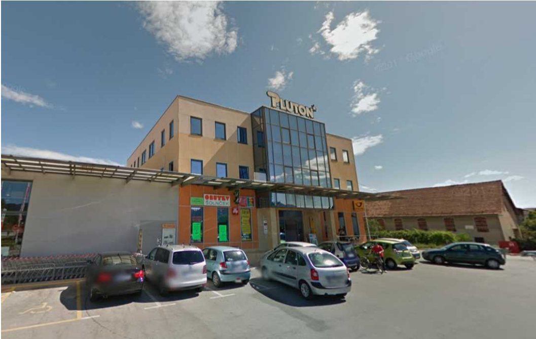
Premoženje Pluton gradenj so pogrebniki podjetij prenesli na druga podjetja in se s tem izognili plačilu davkov.