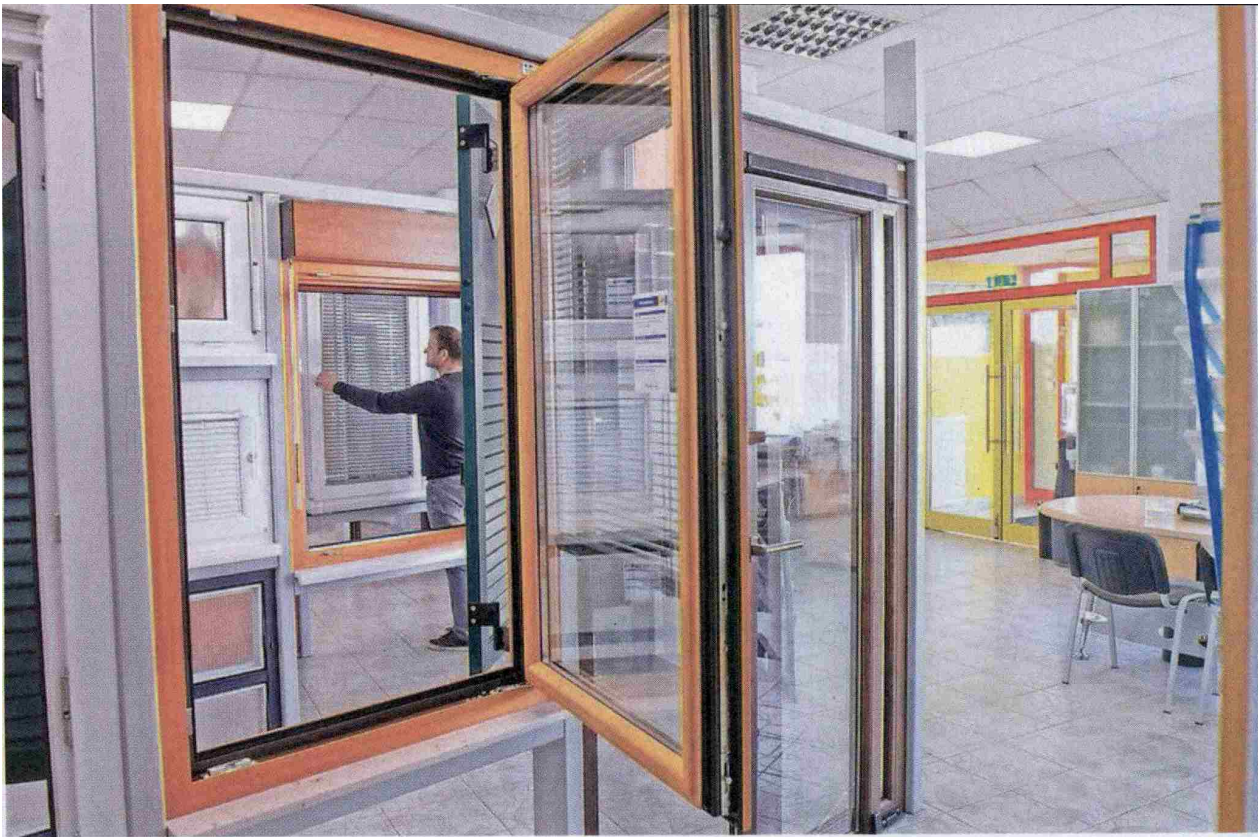
Svojo poslovalnico ima podjetje AJM tudi v Kranju na Cesti Staneta Žagarja.

Zero Sash je, da je pri oknih in balkonskih vratih krilo na videz v celoti iz stekla, brez vidnega okvirja, tudi kljuka je montirana v steklo. Stekljeni rob je v emajlirani črni barvi, podboj okna pa je iz visokokakovostnega slovenskega lesa. Znotraj te linije najdemo tudi vhodna vrata, ki so prav tako v celoti v videzu stekla, tak je tudi podboj. Okna, kot tudi vhodna vrata imajo odlične toplotno- in zvočnoizolativne lastnosti. So rešitev za energetske varčne gradnje.