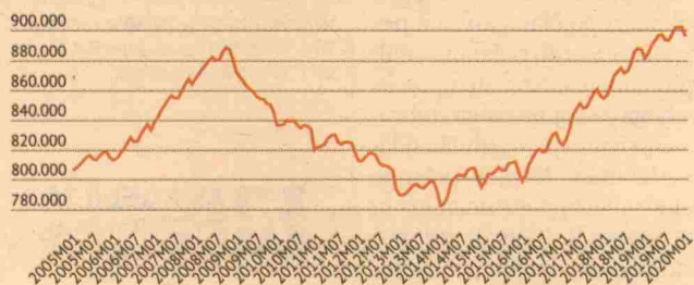
Število delovno aktivnih tik pod 900 tisoč

Po dejavnostih se je število delovno aktivnih oseb najbolj povečalo v dejavnosti promet in skladiščenje, in sicer za 2.200, na približno 57.300 oseb, najbolj pa se je zmanjšalo v predelovalnih dejavnostih, za več kot 2.500, na približno 206.200 oseb, še poroča statistični urad. Po regijah se je najbolj povečalo število delovno aktivnih v osrednjeslovenski statistični regiji (za slabega pol odstotka, na približno 315.900 oseb), najbolj pa zmanjšalo v podravski statistični regiji (za 2,6 odstotka, na približno 123.700 oseb).