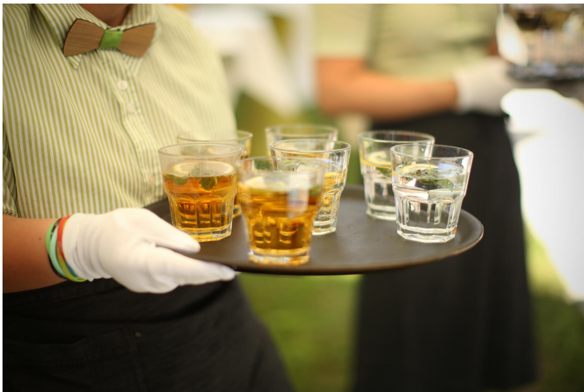
Zaradi pomanjkanja delavcev išče Slovenija ljudi za delo v gostinstvu in turizmu v drugih državah.

Na lestvici deficitarnih poklicev se leto za letom pojavlja, na primer, slaščičar. Vsi vemo, da vsak vrtec, osnovna in tudi srednja šola potrebuje kuharje, slaščičarja pa ne. Vsak hotel, restavracija in gostilna, tudi izletniške kmetije, zdravilišča, potrebujejo kuharje, in to več, veliko, slaščičarja pa morda le enega ali dva. Pekov ne potrebuje vsak hotel, vsaka restavracija, vsaka gostilna, natakarije in kuharje pa. V šolskih kuhinjah največkrat pripravljajo pekovske in slaščičarske izdelke kar kuhar, ki ima široko paleto strokovnih kompetenc. In vendar so tako peki kot tudi slaščičarji uvrščeni med deficitarne poklice, natakariji in kuharji pa ne.