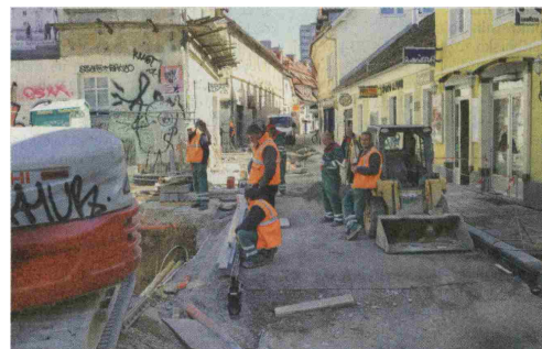
Na Trubarjevi cesti v Ljubljani gradbinci še vedno delajo na gradbišču in hitijo z obnovo ulice.

Morebitne zamude pri rokih za dokončanje, ki bi utegnile nastati, če bodo gradbinci preventivno ustavili dela na gradbiščih, bi podjetja lahko upravičila z višjo silo.