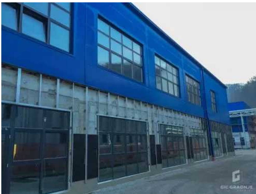
Gradnja nove tovarne Vetropak Hum na Sutli Hrvaškem.

Družba ima trenutno še deset večjih gradbišč v Sloveniji in na Hrvaškem. "Med njimi so stanovanja v Mariboru in Ljubljani, preureditev bančnih prostorov in opreme NKM Maribor, več projektov za Krko Novo Mesto, izgradnja letališča Cerklje Ministrstva za obrambo RS, gradnja nove tovarne Vetropak Hum na Sutli Hrvaškem, Tehnološkega inkubatorja na Hrvaškem in poslovnih prostorov KS Ljubno, dela v Nuklearni elektrarni Krški in mnogo drugih projektov," našteva Cajzek. Če ne bo večjih posledic zaradi širjenja koronavirusa, bo letna realizacija podjetja 60 milijonov evrov. (SP)