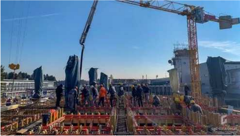
Gradnja potniškega terminala na Brniku zaenkrat po planu.