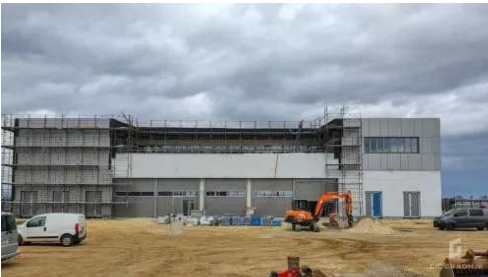
Objekt gasilsko-reševalne službe na letališču Cerklje ob Krki - MORS.

18 milijonov evrov je vredna tudi gradnja nove garažne hiše v Luki Koper, kjer bodo GIC gradnje na površini 120.000 m 2 zgradile parkirane prostore za 65 tisoč vozil. Slatinski gradbinec izvaja tudi mnoge druge projekte.