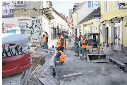
Na Trubarjevi cesti v Ljubljani gradbinci še vedno delajo na gradbišču in hitijo z obnovo ulice.

Medtem ko je vlada v preteklih dneh prepovedala delovanje neživilskih trgovin in opravljanje raznih storitev, te prepovedi ne veljajo v gradbeništvu , če gre za posle za podjetja ali občine. Ali bodo gradbeni delavci kljub nevarnosti širjenja koronavirusa nadaljevali delo, je prepuščeno presoji delodajalcev.