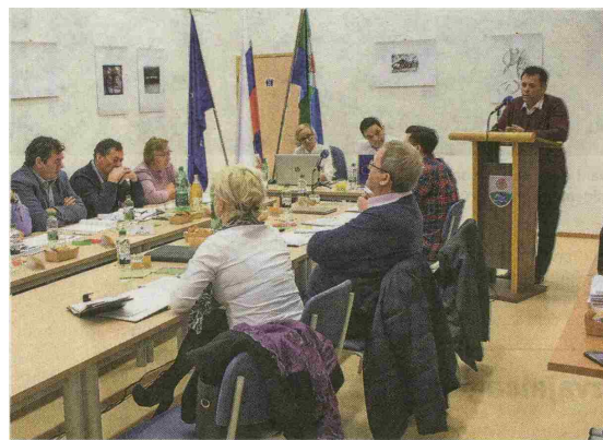
Na tretji izredni seji so se zbrali z namenom potrditve Odloka o spremembah in dopolnitvah Odloka o občinskem podrobnem prostorskem načrtu za stanovanjsko sosesko v Apačah.