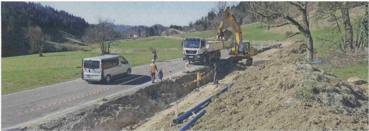
Na vseh živahnih gradbiščih (na fotografiji gradnja kanalizacije in vodovoda v Godoviču) v občini Idrija delavci nosijo gradbeno, ne pa tudi protivirusno zaščito.

IDRIJA, CERKNO • Hidria in Kolektor doma upočasnjujeta, na Kitajskem že na polno