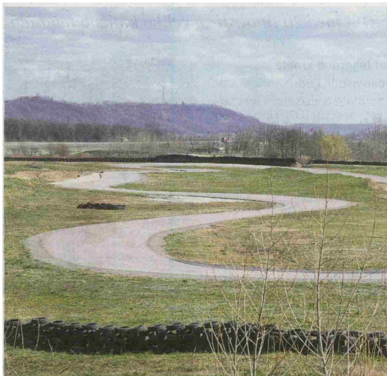
Lindauring je steza za motorna kolesa, na kateri sodeč po objavah motoristov, ki so jo preizkusili, hitrosti lahko presežejo 200 kilometrov na uro.

Upravna enota Lendava je Čabi Lazarju 23. aprila 2018 izdala gradbeno dovoljenje za gradnjo nezahtevnega objekta, to je za športno igrišče na prostem oziroma poligon za kolesa ali motorna kolesa. Upravni organ je pred izdajo dovoljenja ugotovil, da je gradnja skladna z odlokom o spremembah in dopolnitvah odloka o prostorskih ureditvenih pogojih za nižinski del Občine Lendava, po katerem je na območju rekreacijske cone v Petišovcih dovoljena postavitve nezahtevnih in enostavnih športnih objektov ali igrišč. Za izdajo gradbenega dovoljenja pa meritve hrupa niso bile potrebne.