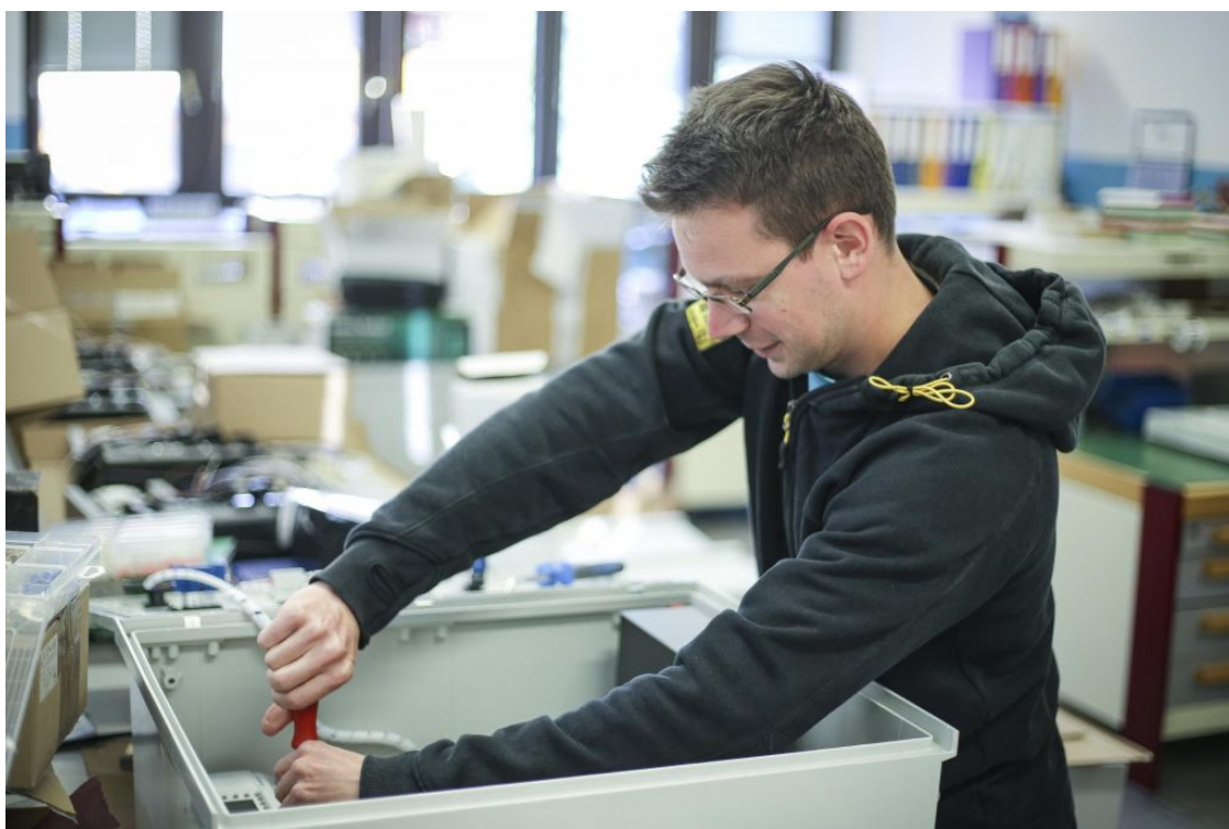
Letošnje drugo četrtletje utegne podjetjem prinesiti najresnejšo preizkušnjo.