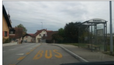
Cesta od cerkve navzgor v Šmihelu je zdaj lepo urejena.

Bralka Anica je imela zanimiv predlog: »Že precej je bilo govora o cesti, ki povezuje Gotno vas s Šmihelom, nad potokom. Promet je na tem odseku neznosen zaradi zelo ozke ceste. Zdaj se bodo pol leta izvajala tudi dela v Šmihelu, zato lahko pričakujemo še več avtomobilov, ki bodo iskali bližnjice. Ker z našega konca ne moremo drugje v mesto kot po tej cesti, bi bilo zelo, zelo pametno in možnost vsekakor za to je, če bi na najožjem delu pri transformatorju uredili enosmerni promet proti Šmihelu. Tu je cesta tako ozka, da je skoraj nemogoče, da se srečata dva avtomobila, da pešcev, tudi šolarjev sploh ne omenjam, poleg tega so na levi strani proti Šmihelu na cesti stopnice za vhod v hišo, na drugi strani pa se cesta dobesedno podira – lomi proti potoku.«