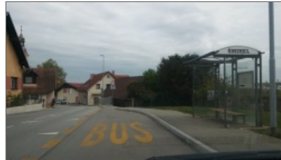
Cesta od cerkve navzgor v Šmihelu je zdaj lepo urejena.