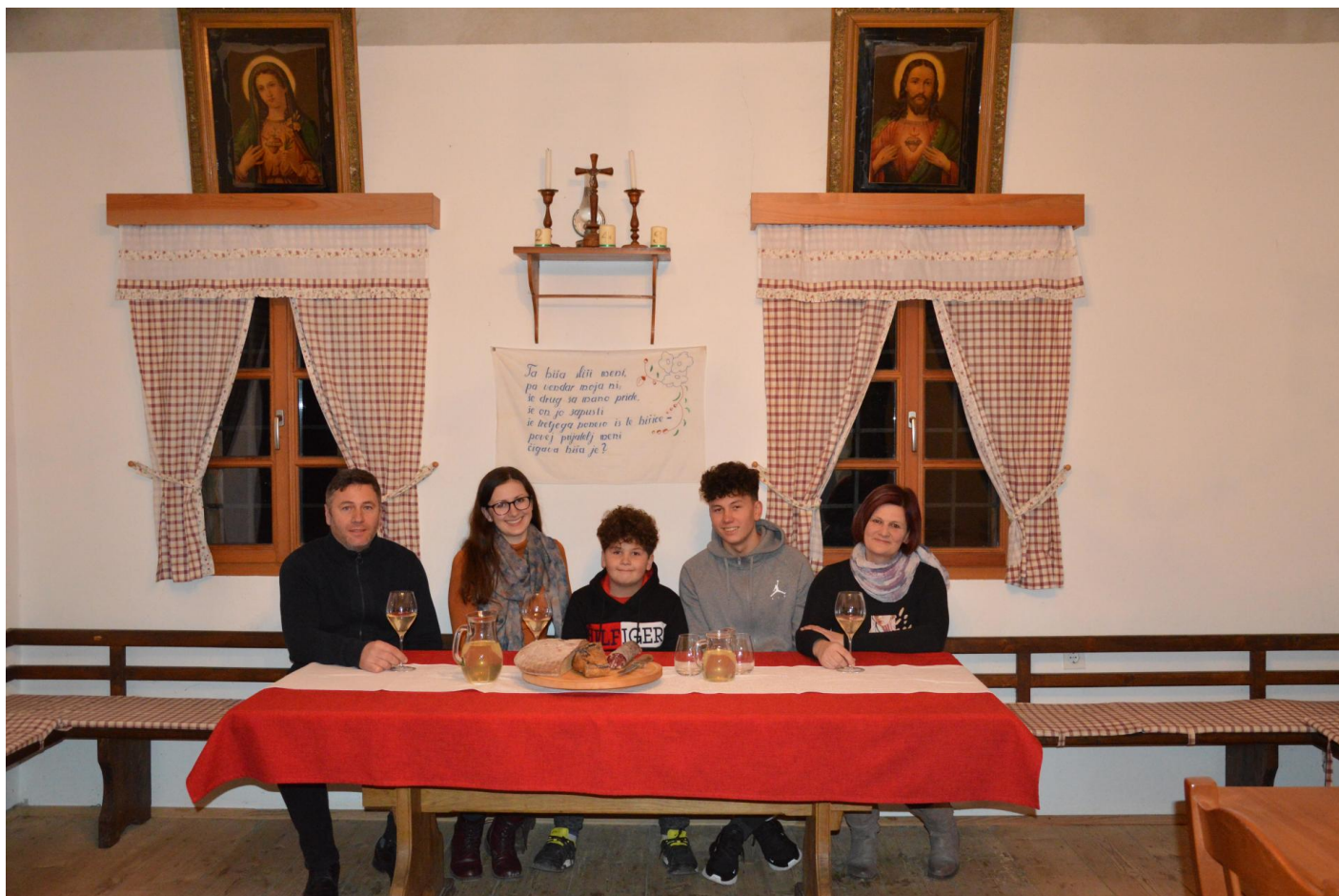
Družina Kavkler, zbrana v skrbno prenovljeni jedilnici, ponosna na svoje delo.