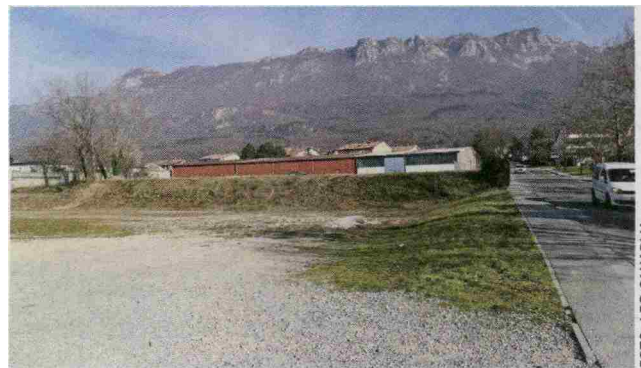
Kdaj bodo znova prodajali zemljišča na Ribniku še ni jasno, župan pa, vsaj za zdaj, ne namerava nižati izklicne cene zanje.

Če bo tako, bo občina razpisala novo javno dražbo, je župan tedaj napovedal in dodal, da občina ne razmišlja o nižanju izklicne cene. S sklepom občinskega sveta ta znaša 55 evrov za kvadratni meter stavbnega zemljišča. Občina bi s pro-