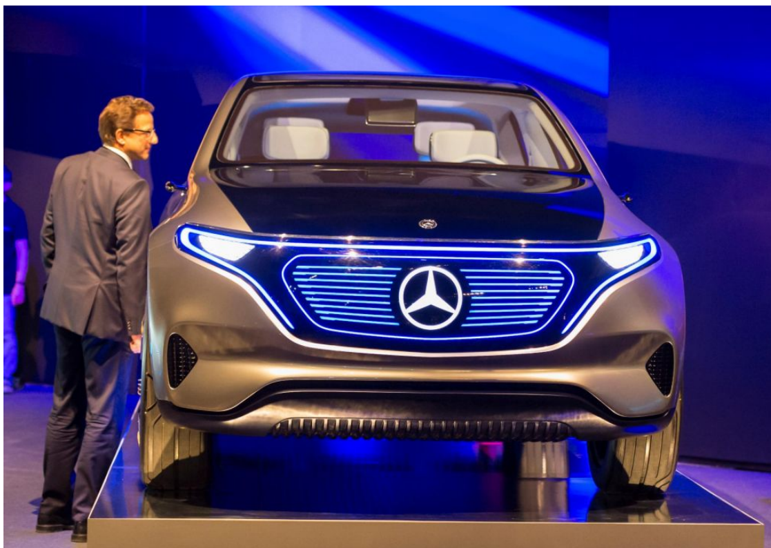
Gospodarsko razpoloženje v Nemčiji se je ta mesec precej popravilo, kaže kazalnik ZEW.