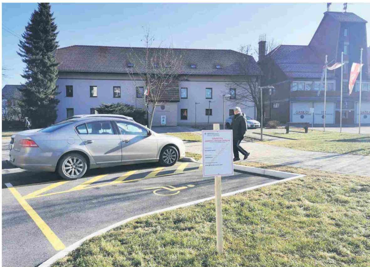
Solastnica zemljišča je podala prijavo na inšpekcijo, ki je tudi ukrepala.

Kmalu po postavitvi table inšpekcije je župan spodbudil razpravo na facebooku, kjer nestrinjanje z ravnanji posameznikov, ki pogodbe nista želela podpisati, tudi ne nujno kulturno, izražajo številni občani. Ker na tak način prihaja do spodbujanja nestrpnosti, žaljivk in obrekovanj, sta občana župana pred enajstimi dnevi pozvala, da objavo umakne. Objava in komentarji na facebooku ostajajo. Župan na vprašanje, ali se mu zdi reševanje problema na takšen način primerno, odgovarja, da prek javne facebook strani obvešča o dogodkih v kraju. Ker takšne table na Korškem še ni bilo, ljudje pa so jo gledali z začudenjem, se mu zdi korektno, da ljudi obvesti, da je tabla tam zato, ker na občini niso dobili soglasja dveh. Danes jim sicer manjka le še eno, triindvajseto soglasje. Župana smo vprašali še, kaj sledi. "Lahko dam dva odgovora, smo pravna država in bomo spoštovali odločbe, drugi pa je, da smo pravna država z nepravim sistemom in imamo desetisoče črnogradenj. Vsekakor bom naredil vse, da pride do razrešitve te situacije, nikakor pa ne v škodo davkoplačevalskega denarja, da bomo okoli 50 tisočakov vrgli stran," je povedal.