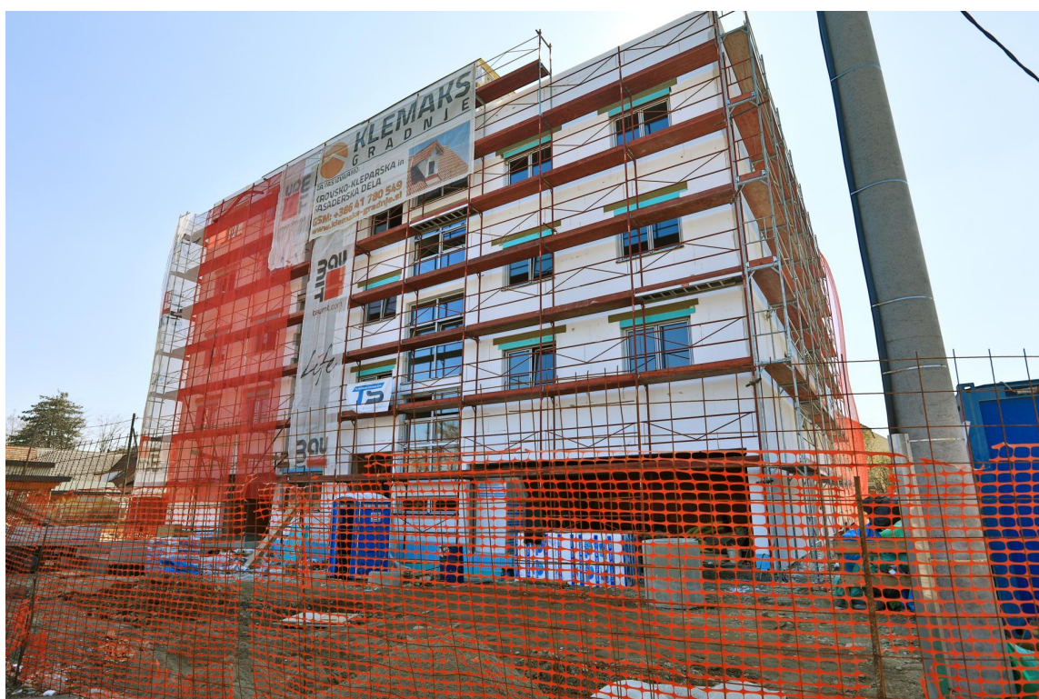
Gradnja bloka ob Ruški cesti ANDREJ PETELINŠEK

novih stanovanj, zato bo povpraševanje v Mariboru še vedno relativno veliko. Kar pomeni, da občutnejšega vpliva na cene nepremičnin naj ne bi bilo.