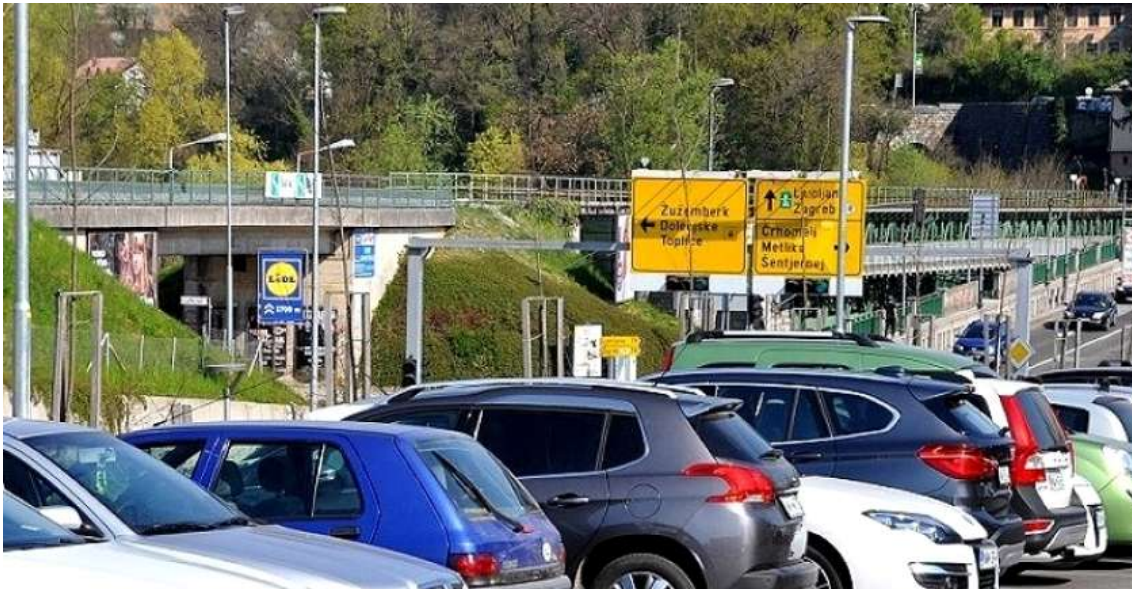
Parkirišče pred Zdravstvenim domom Novo mesto