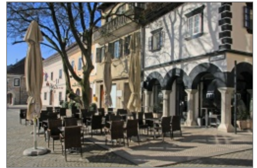
Gostinski lokali lahko zaradi posameznikov, ki namerno podaljšujejo postopek, na izdajo dovoljenja za podaljšanje obratovalnega časa, čakajo tudi po več mesecev.

Kot so sporočili z novomeške občine, so svetniki na njej v prvi obravnavi sprejeli spremembe odloka, s katerimi urejajo izdajo soglasij za podaljšano obratovanje gostinskih lokalov. S tem želi občina poenostaviti postopke in odpraviti nejasnosti pri pridobivanju soglasja. Nov odlok, ko bo sprejet, naj bi občinski upravi omogočil izdajo soglasja v zakonsko predpisanih 15 dneh. Trenutno morajo namreč v nekaterih primerih gostinci za izdajo soglasja izpeljati celo redni upravni postopek, ki ga lahko zainteresirani posamezniki močno ovirajo. Trenutno lahko tak postopek trajal več mesecev oz. celo več kot pol leta.