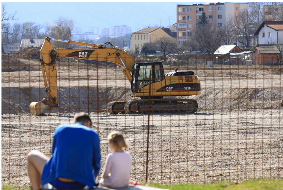
Gradbišče med Čufarjevo cesto in pokopališčem ANDREJ PETELINŠEK