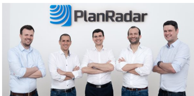
Foto: soustanovitelji podjetja PlanRadar

Investicija je namenjena strateški širitvi na devet novih tržišč in krepitvi poslovanja na obstoječih tržiščih