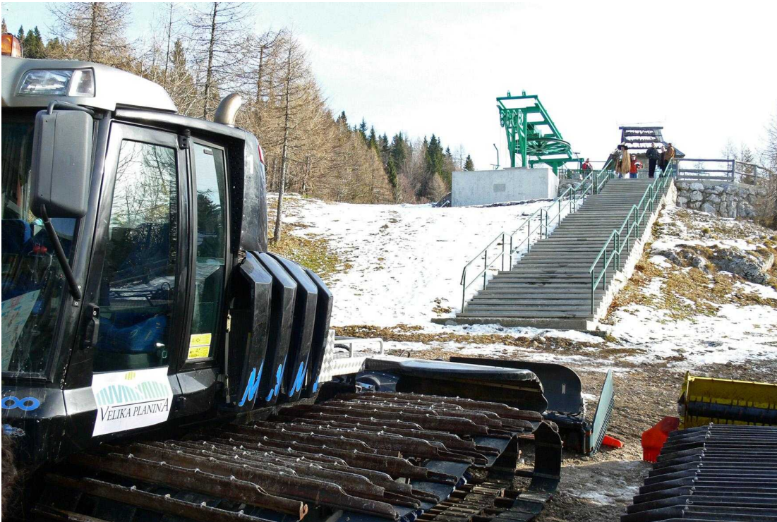
V letošnji sezoni je bilo snega le za vzorec. FOTO: Primož Hieng

»Zakonodaja podaljšanje obratovalnega dovoljenja dovoljuje, če na napravi v preteklih letih ni bilo izrednih dogodkov in je bila pregledana v skladu s prepisi, in nihalka je bila.« dodaja Keder. »Tako je bil 2. in 3. decembra lani opravljen izredni pregled z namenom podaljšanja obratovanja, a je pokazal določene varnostne nepravilnosti v nosilnih vrveh, zaradi česar ZAG ni podal pozitivnega mnenja, s katerim bi lahko podaljšali obratovalno dovoljenje. Naj poudarim, da nihče od preglednikov ali strokovnega osebja družbe ni pričakoval, da bodo nosilne vrvi v takšnem stanju, saj so bile periodično pregledovane v skladu s predpisi. V teh pregledih ni bilo na njih nikakršnih napak. Vzrok, zakaj so se vrvi poškodovale, bo mogoče odkriti šele, ko bodo na tleh in jih bomo dali v podrobni pregled. Obstaja tudi možnost, da je prišlo do udara strele. Poleg tega lahko povemo, da v EU in širše ni veliko podjetij, ki se ukvarjajo z izdelavo in montažo tovrstnih vrvi. Za naše razmere gre sicer za večjo investicijo, z vidika podjetij v EU, ki se ukvarjajo s tovrstnimi projekti, pa gre za manjši projekt, za katerega očitno niso bili zainteresirani.«