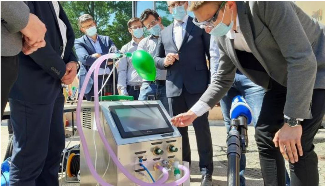
Predstavitve naprave Diham, enega od štirih prototipov medicinskega ventilatorja