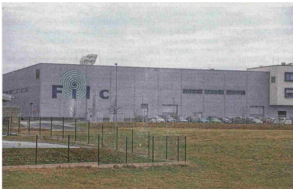
Škofjeloški Filc odslej v nemških rokah

Skupina Freudenberg, ki posluje v 60 državah in je predlani ustvarila več kot devet milijard evrov prometa, razvija proizvode in storitve za okoli 40 tržnih segmentov in za številna področja uporabe, kot so tesnila, komponente za nadzor vibracij, netkane tekstilije, filtri, specializirane kemikalije, medicinsko-tehnični izdelki in čistila.