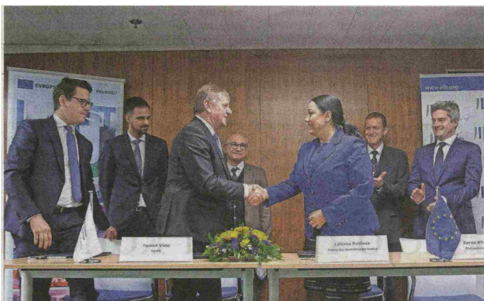
Podpis pogodbe o najemu posojila za izgradnjo druge cevi in obnovo obstoječe cevi z Evropsko investicijsko banko

Na Občini Jesenice so povedali, da bodo oblikovali delovno skupino, ki bo spremljala gradnjo in pri odprtih vprašanjih zastopala interese lokalne skupnosti.