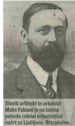
Sloviti arhitekt in urbanist Maks Fabiani je na lastno pobudo izdelal urbanistični načrt za Ljubljano. Brezplačno.

Število okuženih z novim koronavirusom se je v soboto povečalo za 46, tako da je skupna številka vseh okuženih že narasla na 730. Hkrati se je povečalo število hospitaliziranih na 101, na intenzivni negi pa jih je po novem 23. V soboto sta umrli še dve osebi, tako da je virus doslej zahteval že 11 življenj. A. B.