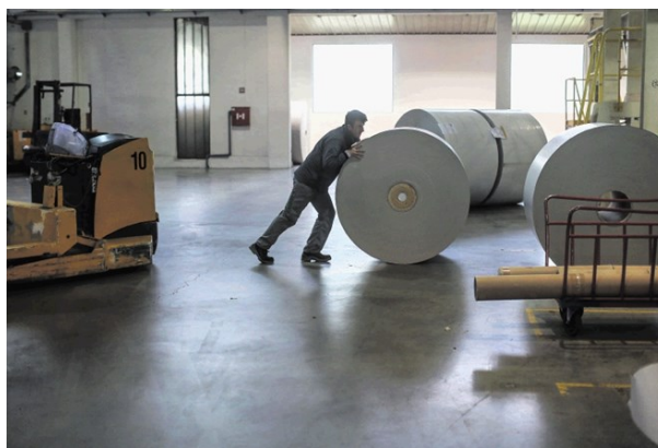
Koliko ljudi bo zaradi epidemije koronavirusa izgubilo delo, je težko oceniti, zagotovo pa število ne bo majhno.

V sindikatih opozarjajo, da prihaja zaradi epidemije novega koronavirusa v številnih dejavnostih do množičnega odpuščanja. V delodajalskih organizacijah ocenjujejo, da bodo predvideni vladni interventni ukrepi odpuščanja zajezili zgolj začasno in da se bo število brezposelnih močno povečalo.