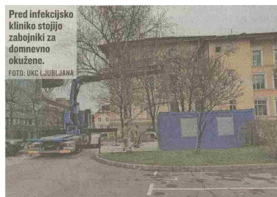
Pred infekcijsko kliniko stojijo zabojniki za domnevno okužene.